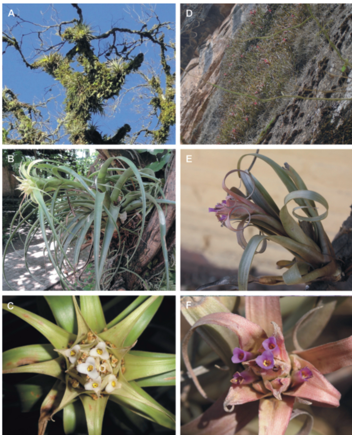
Fig.1. Tillandsia schreiteri (A – C). A: Planta en su hábitat natural. B: Aspecto de la planta. C: Detalle de la inflorescencia. T. sphaerocephala var. tarijensis (D – F). D: Hábito y hábitat de la variedad. E: Aspecto de la planta. F: Detalle de la inflorescencia.