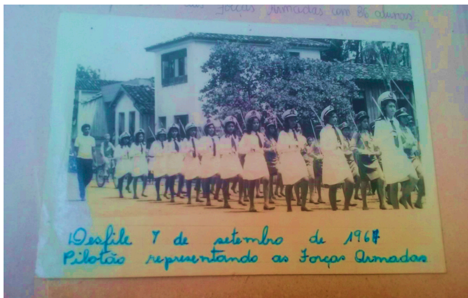
Figura 7: Desfile de 7 de setembro de 1967