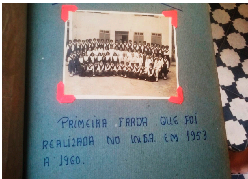
Figura 1- Uniforme do INSA no período de 1953 a 1960