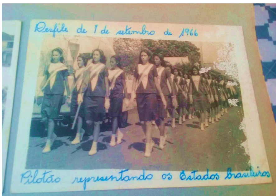
Figura 5– Desfile do dia 7 de setembro de 1966