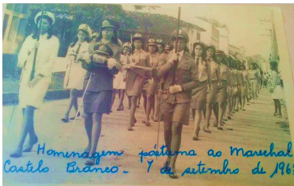
Figura 6 - Homenagem das alunas a Marechal Castelo Branco.