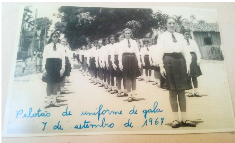
Figura 4 – Pelotão de alunas em 7 de setembro de 1967