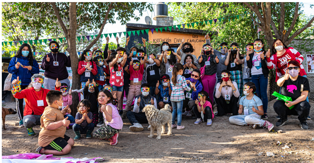
Figura N° 12: Lxs niñxs evalúan con pulgarr arriba o pulgarr abajo lo que les pareció el juego colectivo

Al mismo tiempo, vamos a señalar que esos encuentros lúdicos con infancias nos interpelaron en las lógicas, además de manejar las propias ansiedades que, como decíamos arriba, el tiempo productivo adulto conlleva. Intentar vivenciar sus disfrutes más allá de si nosotrxs comenzábamos a aburrirnos, a cansarnos, a estar incómodxs en las posturas corporales, al malestar o tristeza que nos producían ciertas escuchas. Por lo cual, nos invitan a desandar cómo implicar a otrxs agentes de socialización que acompañen en esto de “poetizar los daños” (Flores, 2015) desde formas no represivas ni preventivas punitivistas para posibilitar ejercicios de “justicia erótica” (Rubin, 1989; Canseco, 2016). Cómo acompañarles desde esas otras lógicas de hacer, sentir y estar en el mundo.