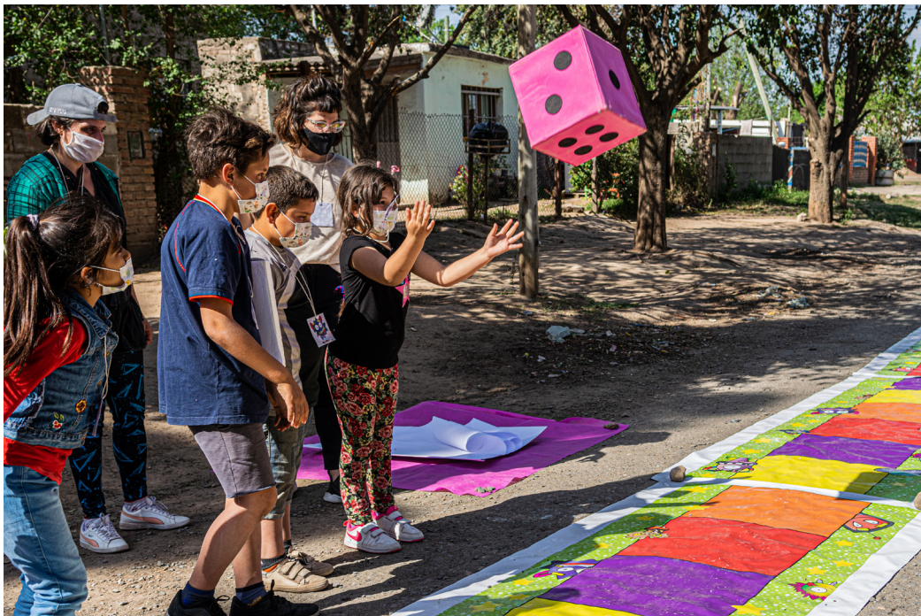
Figura N° 8: Uno de los subgrupos tira el dado para avanzar en los casilleros