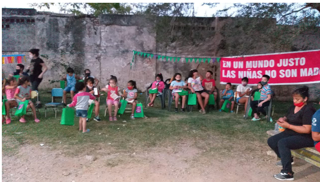
Figuras N° 3: Un grupo de niñxs recibe sus bolsitas con el juego de mesa

Cuando se anunciaron medidas de distanciamiento social para noviembre de 2020, pudimos avanzar con el encuentro con las infancias que asisten a los comedores comunitarios de ambos barrios del mencionado espacio de activismo, para la distribución de estos primeros 200 juegos de mesa que logramos imprimir 14 .