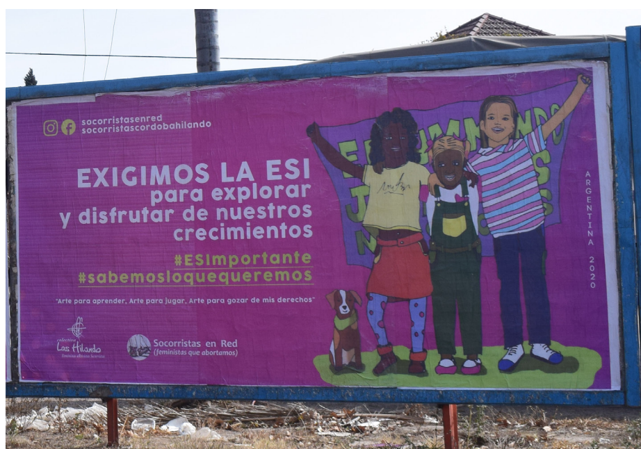
Figura N° 1: Cartel en vía pública

Esta primera parte de la ejecución del proyecto conllevó también la participación en distintos medios masivos y alternativos de comunicación 12 , para difundir y poner en valor este desafío de disputar sentidos, por un lado, con los neoconservadurismos -que suelen estar en alianza con sectores de derecha y neoliberales-, y por el otro, con los sentidos sociales que vienen arraigados en nuestras culturas, que venimos contextualizando. Es decir, una acción que devenga en contrapunto de aquellos sentidos que tornan la sexualidad como alejada de las infancias, sostenida a fuerza de negación, represión, disciplinamiento y silenciamientos como políticas sexo-afectivas imperantes.