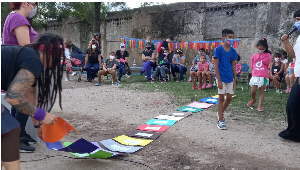
Figura N° 5: Armado del tablero que serviría de muestra del juego de mesa (Imagen de Hilando)

Fue un recibimiento hermoso, hacía tiempo que lxs niñxs no se juntaban a jugar en el comedor. Armamos una especie de tablero con cartulinas con el fin de poder contarles a lxs niñxs de qué iba el juego, y luego cada quien se llevó el suyo. Las repercusiones fueron muy buenas, lxs referentes de “Libres en lucha” nos contaron que fueron al otro comedor en Campo de la Ribera a repartir más juegos y materiales y el clima de alegría fue reconfortante.