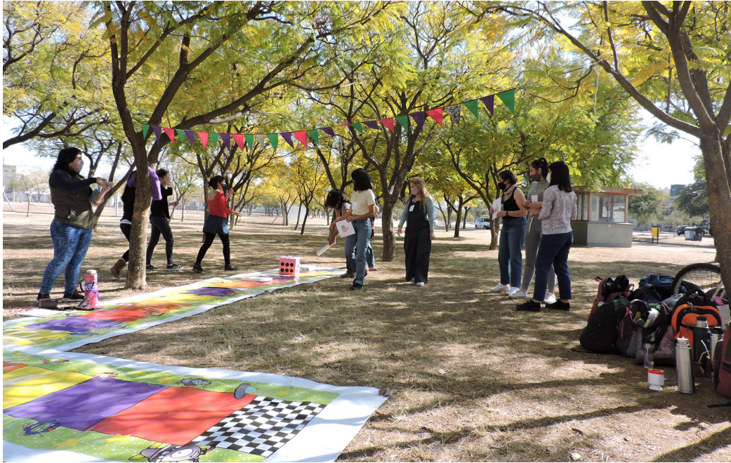
Figuras N° 7: Un grupo de socorristas realiza una consigna de baile