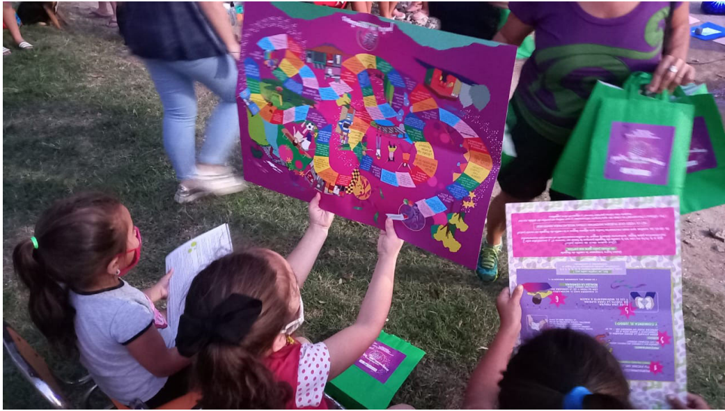
Figura N° 4: Niñxs mirando el tablero del juego de mesa que recibieron

Fue un recibimiento hermoso, hacía tiempo que lxs niñxs no se juntaban a jugar en el comedor. Armamos una especie de tablero con cartulinas con el fin de poder contarles a lxs niñxs de qué iba el juego, y luego cada quien se llevó el suyo. Las repercusiones fueron muy buenas, lxs referentes de “Libres en lucha” nos contaron que fueron al otro comedor en Campo de la Ribera a repartir más juegos y materiales y el clima de alegría fue reconfortante.