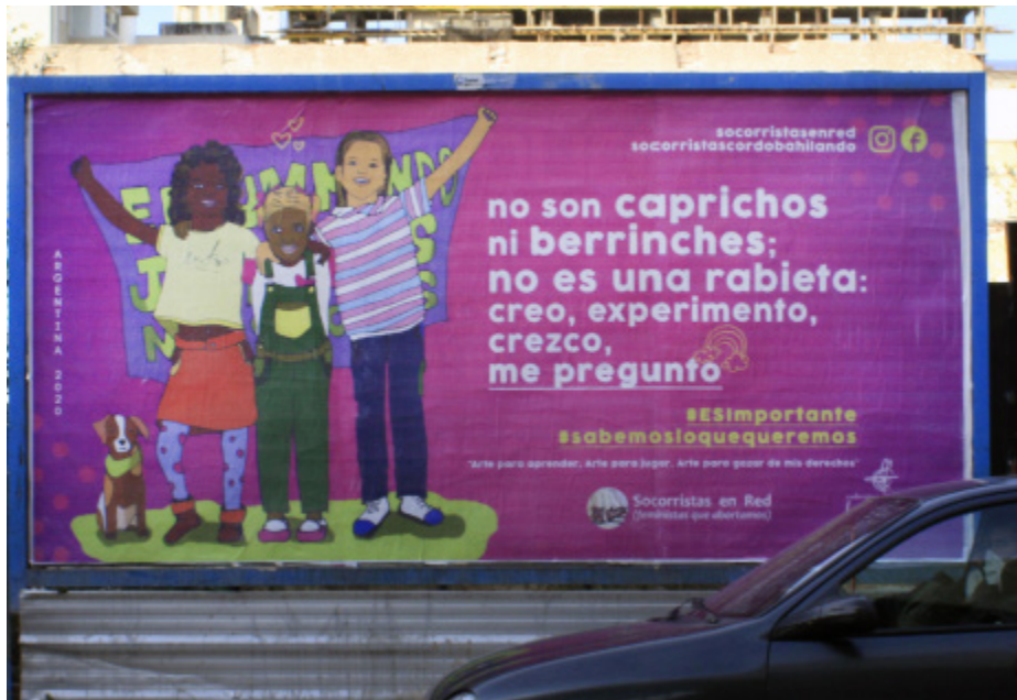
Figura N° 2: Cartel en vía pública

También se crearon hashtags para difusión en redes sociales: #sabemosloquequeremos #infanciasprotagonistas #infanciasdeseantes #infanciascreciendolibres #infanciasescuchadas. Considerando que estas formas expresivas pueden horadar en lo cotidiano para disputar narrativas que posicionan a las infancias en la inocencia, en el desconocimiento y en la falta, en la biologización y psico-pato-logización de sus experiencias en torno a sus cuerpos, emociones, pensamientos y acciones.