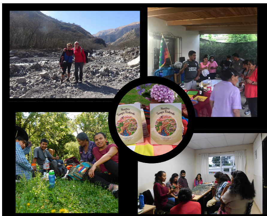
(figura nº 2).