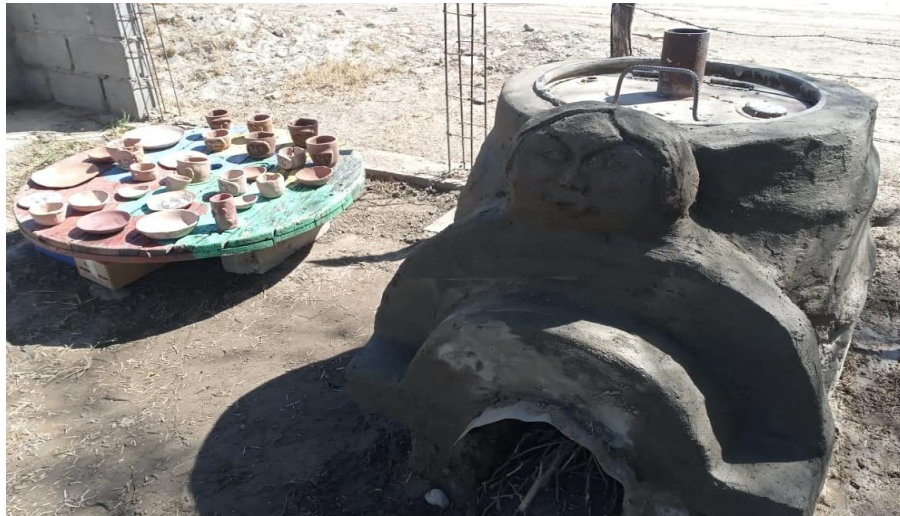
Figura 9. Horno terminado junto a la producción del Taller de Cerámica