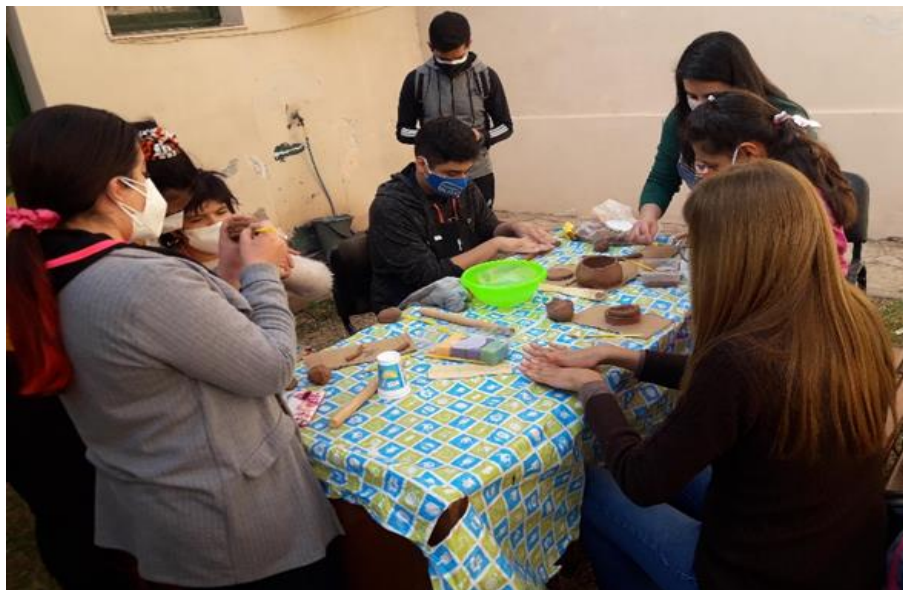
Figura 15. Taller de Cerámica en el patio del Museo