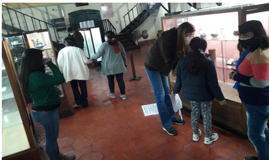
Figura 14. Recorrido guiado por el MAAQ