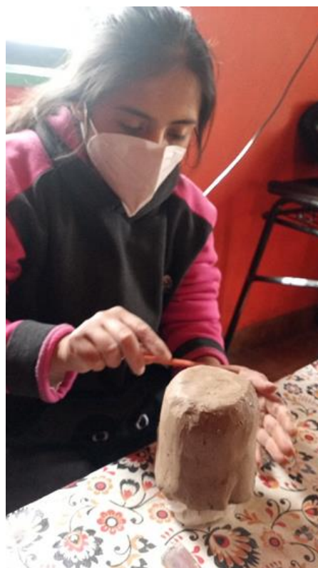
Figura 3. Técnica de levantado por molde