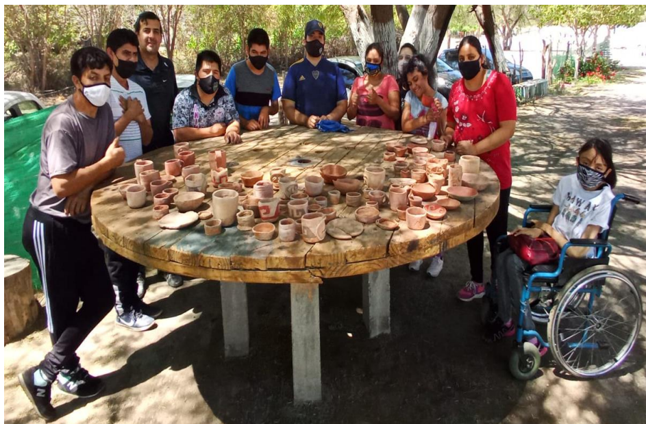
Figura 13. Producción total del Taller de Cerámica