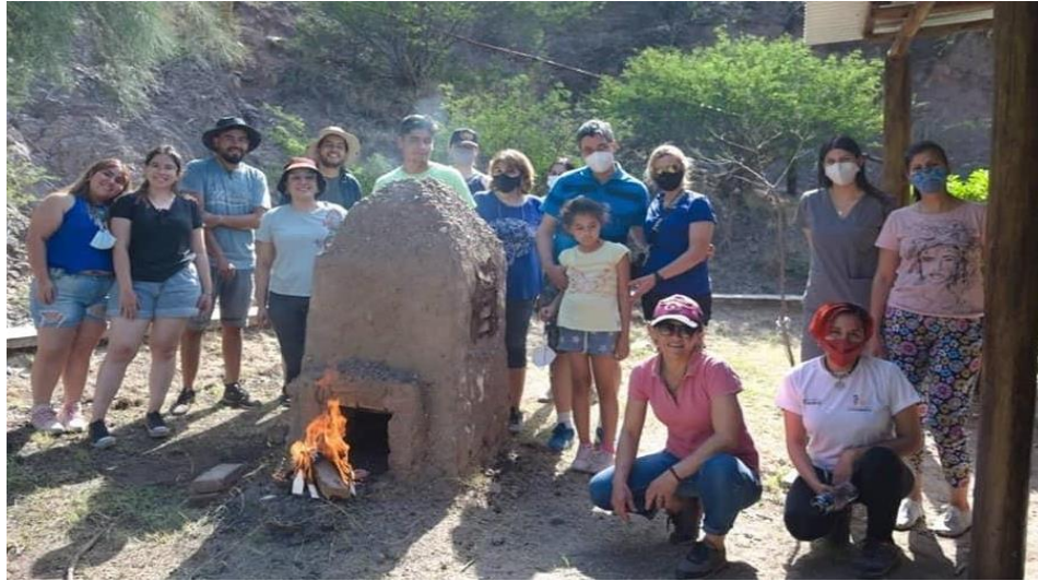
Figura 16. Quema en el CIPPO