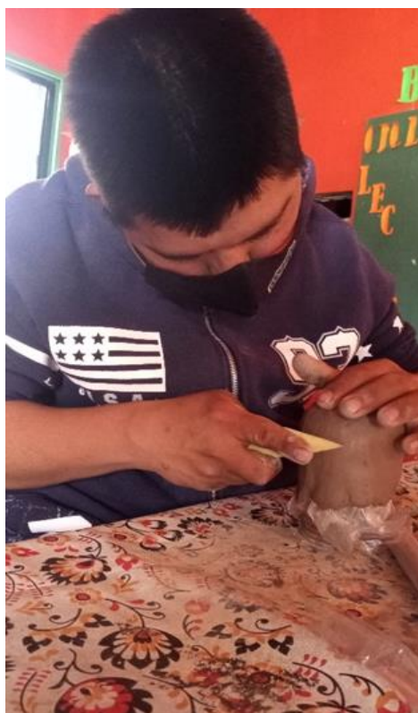
Figura 2. Técnica de levantado por molde