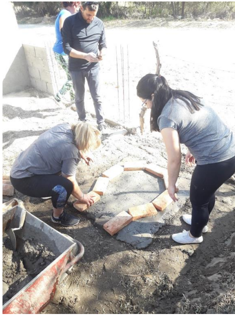
Figura 6. Armado de la base del horno