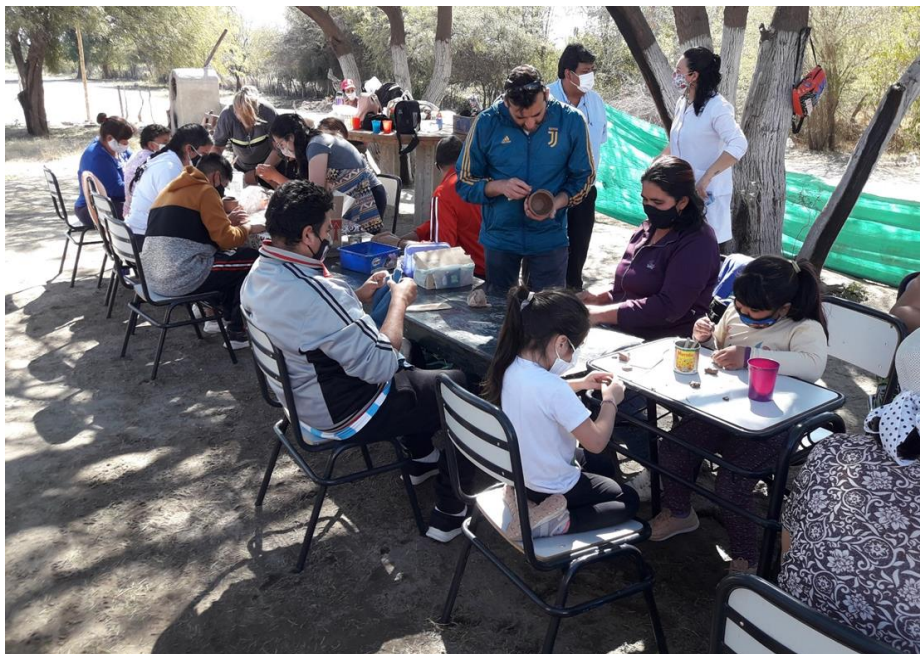
Figura 8. Taller de Cerámica como cierre de jornada

En los días siguientes, continuaron trabajando, dando los detalles a la parte exterior del horno. Se añadieron dos filas más de ladrillos, haciéndolo más alto, y se modeló un rostro humano sobre la boca del horno. Además, le construyeron una tapa (Figura 9).