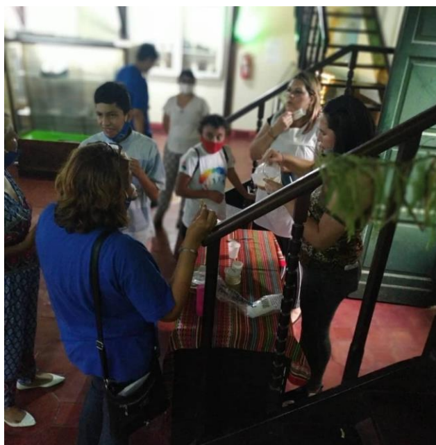
Figura 21. Degustación de añapa y alfajores de algarroba