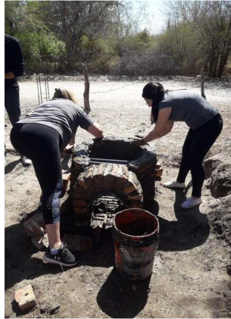
Figura 7. Colocación de la parrilla

Comenzamos haciendo una corpachada , pidiendo buen augurio para hacer crecer el barro. Hacia la parte posterior del lugar elegido para erigir el horno, abrimos un pequeño pozo, y depositamos como ofrenda a la tierra, alimentos y bebida. En conjunto, trabajamos a lo largo de la jornada dando forma a la estructura del horno. Por la tarde, se dio el cierre con un hermoso taller dictado por Marcia, Martín y Griselda (Figura 8).