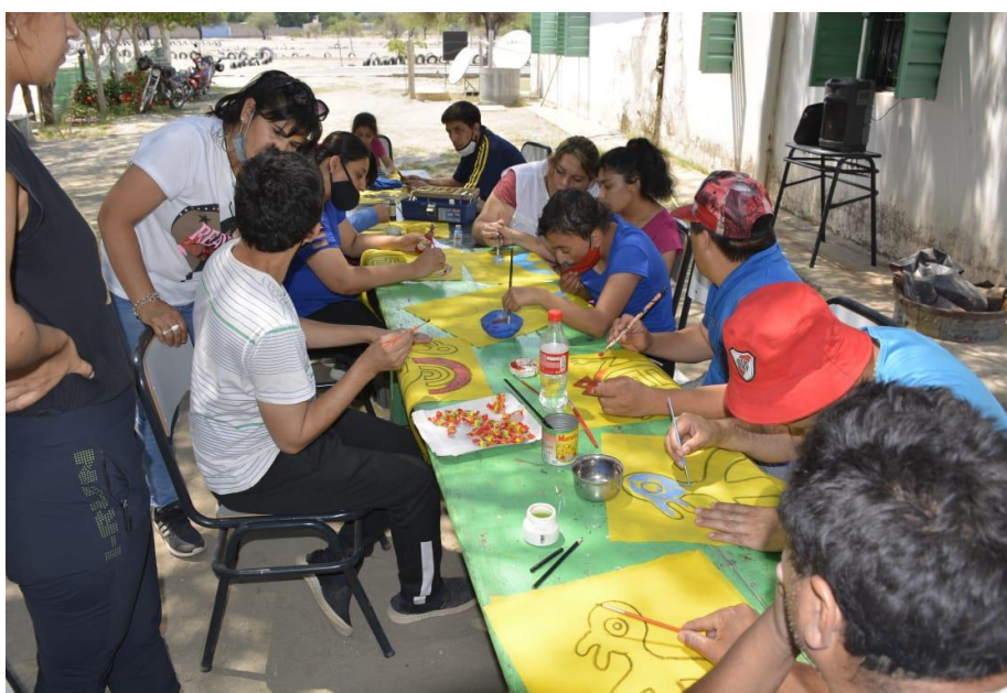
Figura 12. Taller de pintura

Pasaron unos días, y en presencia de Marcia se hizo la apertura del horno, dando cuenta de la gran calidad de las piezas producidas, resaltando las tonalidades acabadas. Allí cada estudiante se dispuso a seleccionar las piezas que formarían parte de la muestra final, para lo cual primaron diversos criterios, desde el estético hasta el afectivo (Figura 13).