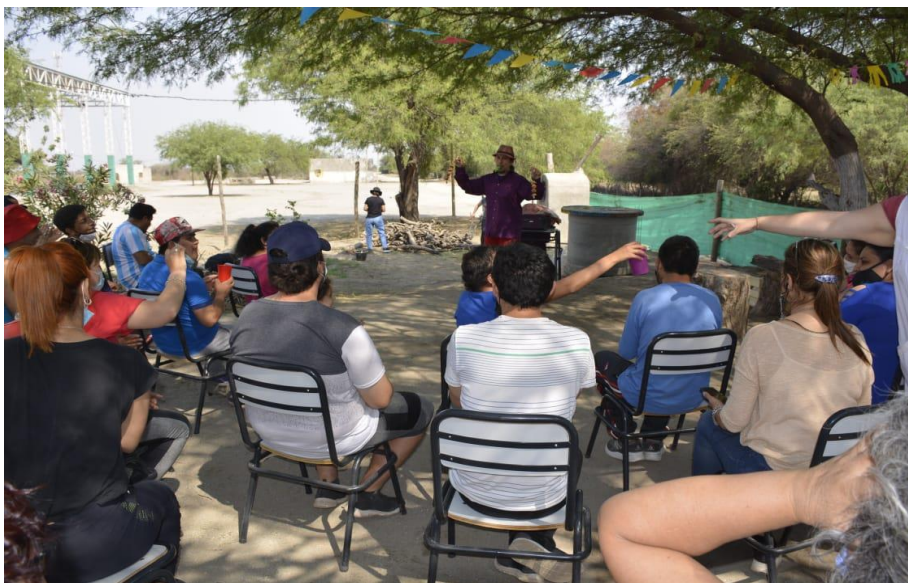
Figura 11. Show de títeres

Mientras se avivaba el fuego, y mantenía el calor de la quema, los/as estudiantes disfrutaron de un show de títeres, y luego un taller de pintura. Almorzamos y compartimos un rato más de risas (Figura 11 y Figura 12).