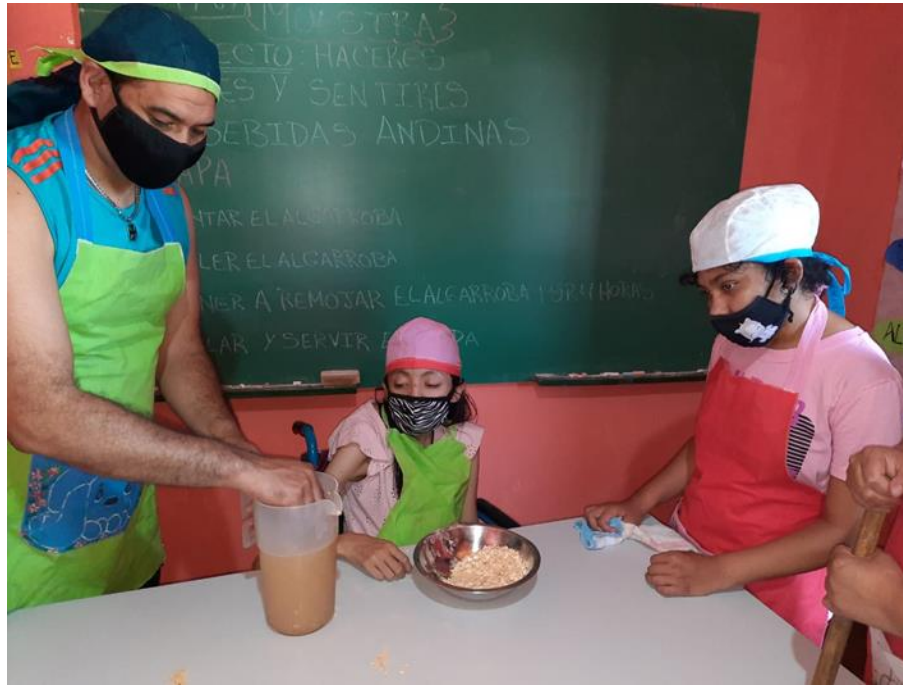
Figura 5. Preparación de añapa en la Escuela