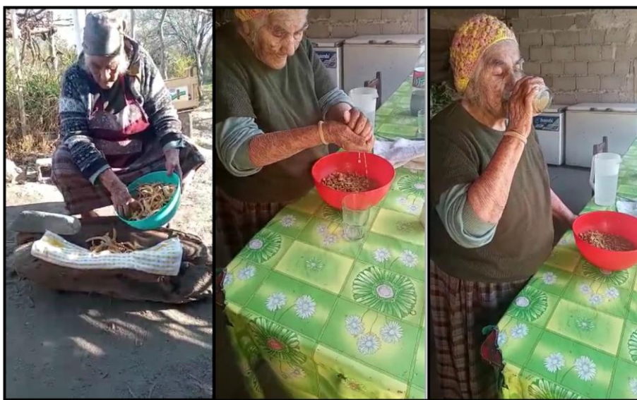
Figura 4. Elaboración de añapa por la mamá de un estudiante de la Escuela

Para ambos talleres, desde el Museo nos comprometimos a facilitar la materia prima: arcilla y algarroba, para dar inicio a los mismos. Los profesores se encargaron de acercar el material a cada estudiante, puesto que para ese momento Saujil se encontraba en fase roja, y las clases presenciales habían sido suspendidas.