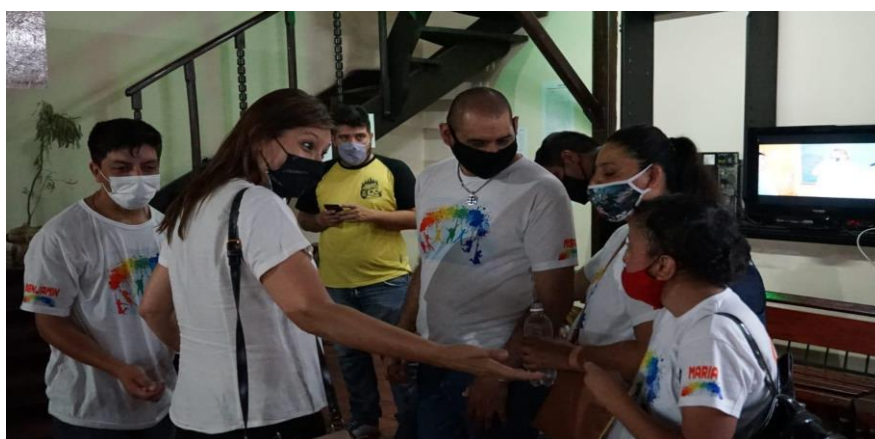
Figura 18. Sector del televisor

Para este sector, creamos tres audiovisuales 6 , a partir de videos y fotografías realizadas por estudiantes y familiares. Estos videos fueron reproducidos en un televisor, dando muestra del proceso de preparación de la añapa (Figura 18).