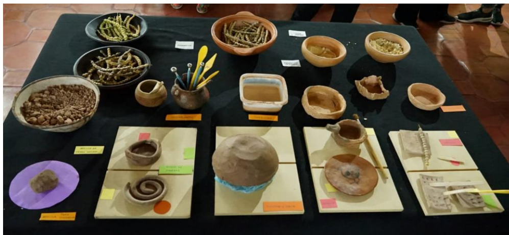
Figura 20. Sector Espacios de encuentro, mesa expositiva

preparaciones, con la posibilidad de que los públicos puedan experimentar cómo se prepara/manufactura (Figura 20).