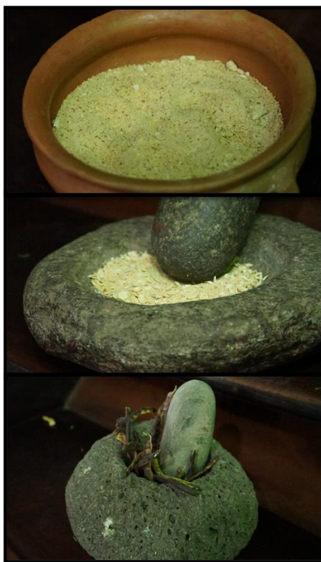
Figura 19. Secuencia del preparado de la harina de algarroba

Adyacente al televisor, se ubicaron dos vasijas “Aguada Tricolor” 7 , pertenecientes a la colección arqueológica del Museo, que han sido interpretadas como tinajas de fermentación, utilizadas para la preparación de bebidas antiguas (Gastaldi 2010). Sobre la escalera, al costado de las vasijas, se dispuso a modo de secuencia de preparado, dos morteros en cuyo interior presentaba momentos de la molienda de las semillas de algarroba, y un recipiente de cerámica que contenía harina de algarroba (Figura 19).