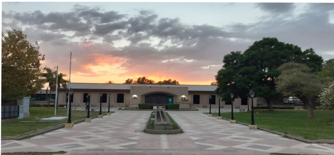
Fig. 1. Fachada del Museo del Área Fundacional en la Plaza Pedro del Castillo.

En continuidad con el mencionado proceso de valorización del sector, en 2008 la Municipalidad de Mendoza integró todo el antiguo casco histórico de la ciudad bajo el concepto de Área Fundacional (Chiavazza, 2011). El mismo comprende al Museo y la fuente colonial subterránea 2 emplazados en la Plaza Pedro del Castillo, la totalidad de la plaza misma y el predio inmediato de las Ruinas Jesuíticas de San Francisco 3 .