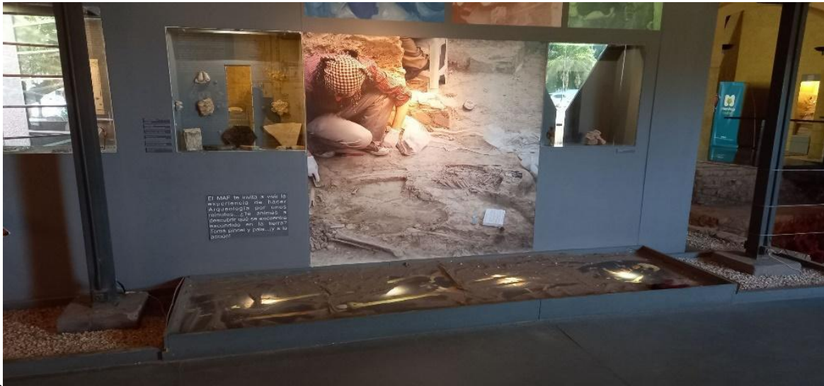
Fig. 5. Excavación arqueológica simulada en la Sala Paisajes de la Dominación.

Estos sitios pueden sumarse al guion para niños/as incorporando sonidos, mayores comodidades, colores, texturas y materiales que mejoren la experiencia y permitan ser disfrutados por mayor cantidad de personas.