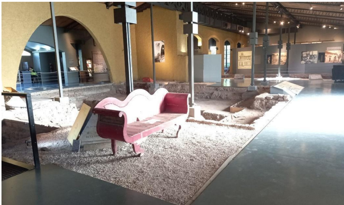
Fig. 2. Excavaciones arqueológicas sin cierre perimetral.

- Existencia de ciertos espacios inseguros para niños/as. Algunas excavaciones arqueológicas se encuentran sin barandas ni barreras que impidan su ingreso, pudiendo resultar peligrosas en caso de caída (Fig. 2).