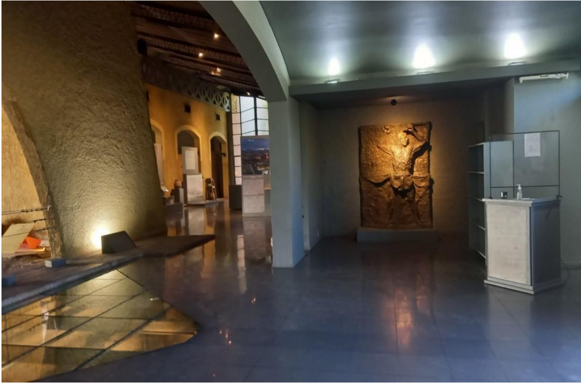
Fig. 3. Actual sector de Recepción del Museo.