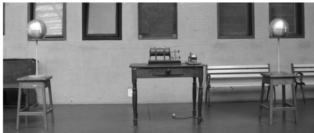
Fig. 2. Dispositivo experimental montado en el LEF.

carrete de Ruhmkorff que tiene la función de elevar la baja diferencia de potencial eléctrico del primario, 12 V, a unos 50 kV en el secundario y por dos esferas metálicas de 5 cm de diámetro, unidas por dos cables de un metro de longitud a los explosores del carrete de Ruhmkorff, que proporcionan la capacidad del circuito oscilante. Como detector se utilizaron espiras rectangulares de diferentes medidas. A diferencia del experimento original, a fin de facilitar la detección, se conectó la espira receptora conectadas a un osciloscopio de 40 MHz de ancho de banda.