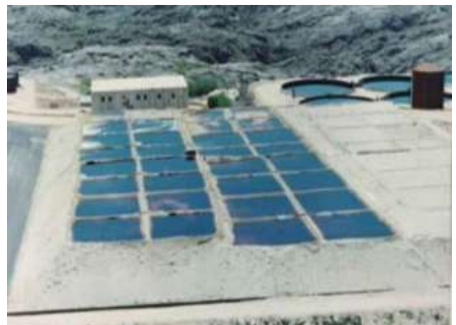
Fig. 9: Piletones de lixiviación de la Mina Schlagintweit (uranio). Foto original.

El lento decaer del mármol dio lugar al nacimiento de la industria del granito y la experiencia en la cantera le permitió ser el abastecedor de materiales de construcción (Fig. 10), como en un giro irónico de la historia, volviendo a lo dicho en los primeros informes de los exploradores españoles.