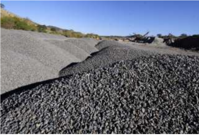
Fig. 10: Playa de acopio de materiales CANTESUR. Foto de gentileza.

Los autores concluyen que: “El desafío del crecimiento de la actividad minera de Córdoba y de las industrias de elaboración de los productos deberá consensuarse entre la sociedad y los administradores políticos...” .