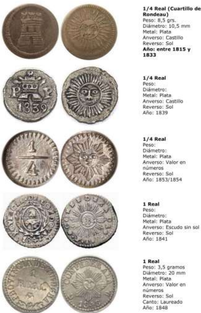
Fig. 5: Primeras monedas.

Estas primeras monedas tuvieron un enorme efecto geopolítico no sólo en la gesta libertaria sino en la relación de poder entre el interior y la cada vez más creciente influencia del puerto de Buenos Aires.