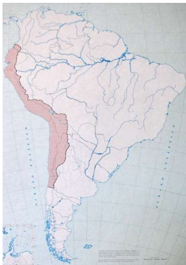
Fig. 2: El imperio Inca (Randle P. H., 1981. Atlas del Desarrollo Territorial de la Argentina. Madrid, España).

Los autores refieren al imperio incaico debido a la manifiesta penetración cultural y ciertos datos dispersos que los acercan a nuestra provincia.