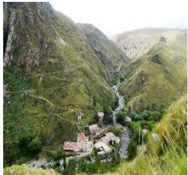
Fig. 6: Viejo poblado minero de las minas de Wolframio de Cerro Áspero, rebautizado turísticamente como Pueblo Escondido. Foto original.

La minería de Córdoba se circunscribe a su territorio actual y, pese a la escasez relativa de metales en el área, esta es una época de sucesos notables para el sector. El desarrollo de explotaciones y empresas, por momentos caótico y rocambolesco, responde a eventos bélicos lejos de sus fronteras. Se destaca la explotación de wolframio, sin dejar de mencionarse otros metales. Suele afirmarse que gran parte de los caminos de Córdoba nacieron durante este período de auge por el wolframio y por las pequeñas vetas de cuarzo aurífero o las de galena argentífera.