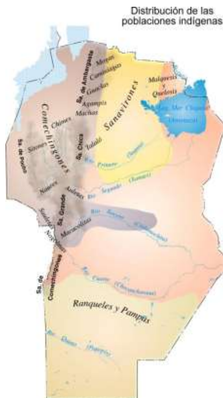
Fig. 3: Distribución de los pueblos originarios (KEEGAN RA, 2000. Córdoba Nuestra Historia. Keegan Ediciones SRL y La Voz del Interior).

El relato continúa con las circunstancias que llevaron al primer denuncia minero de Córdoba, además de la triste historia de la muerte de Blas de Rosales y los cruentos eventos del cerro Charalqueta o Colchequí donde tantos Comechingones perdieron su vida (Fig. 3).