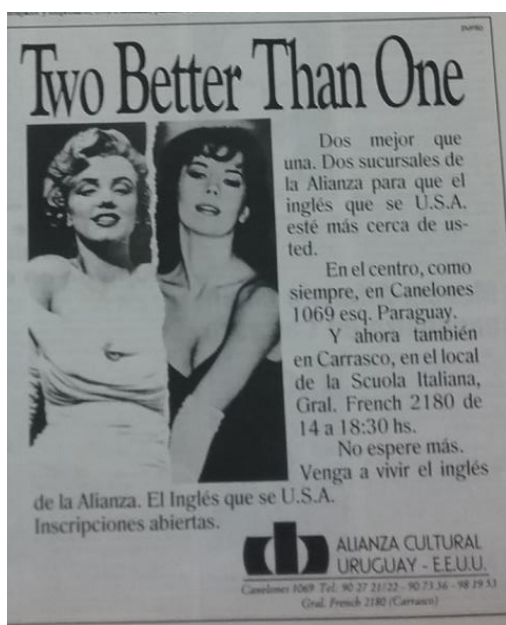
Imagen 2 – Alianza Cultural Uruguay EEUU, El País , 1990

meta son fácilmente reconocidas por la audiencia imaginada. Por su parte, la Imagen 3 pertenece al Instituto Cultural Anglo Uruguayo , y en ella se observa la presencia de un ícono de la cultura musical británica (Mick Jagger), en este caso presentado en forma de caricatura.