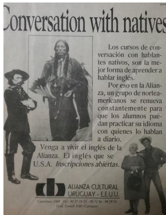
Imagen 1 – Alianza Cultural Uruguay EE.UU., El País , 1990

En estos avisos de la década del 90 hay una clara referencia en el texto escrito y en las imágenes a la historia y la cultura inglesa. En el siguiente aviso (Imagen 1) se pueden observar dos personajes históricos: Toro Sentado y el General Custer, la imagen de un vaquero ( cowboy ) considerado como el epítome de la cultura local americana, así como también un personaje cinematográfico (Mrs. Doubtfire) muy popular en esa época. El texto escrito hace referencia a la importancia de aprender inglés con hablantes nativos, relacionando imagen y texto con la importancia de los hablantes nativos para la lengua meta.