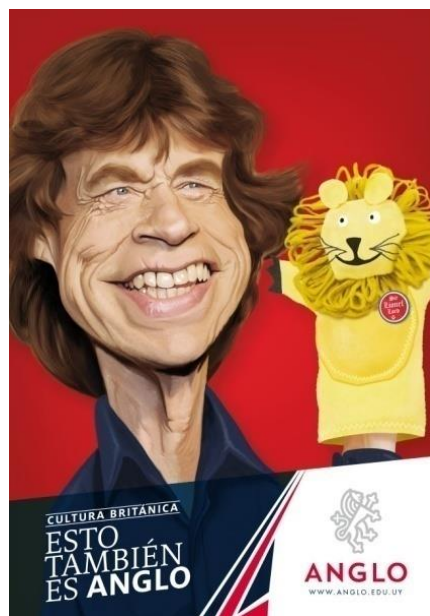
Imagen 3 – Instituto Cultural Anglo Uruguayo, vía pública, 2015

En lo que refiere a los productos culturales, se puede constatar que estos son, de hecho, los propios personajes famosos que se representan visualmente. El hecho de que la publicidad de la lengua apele a estos íconos se vincula estrechamente con la noción de que en la promoción del inglés se encuentra el deseo de aprender esta lengua por sus “connections with popular culture, films, television, popular music and other forms of mass entertainment” (Tollefson, 2000, p. 10). Es dentro de este contexto que ciertos productos propios de la cultura popular industrializada anglosajona se convierten en productos de consumo que se puede suponer son conocidos por la audiencia imaginada, productos de mejor calidad que los de la cultura propia. Esto explica, además, el hecho de que como actores sociales representados ninguno de ellos se encuentra nominado, sino que más bien solo se muestra visualmente su identidad a través de un proceso visual conceptual, sin la necesidad de identificarlos por su nombre o de presentarlos en procesos narrativos específicos (Kress y van Leeuwen, 2021); su identidad visual es suficiente para que se los asocie con la cultura norteamericana o la británica.