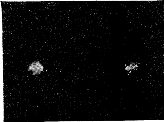
(Fotografía No 2)

fueron de distinto tamaño y en su totalidad del tipo S (Fotografía No. 2).