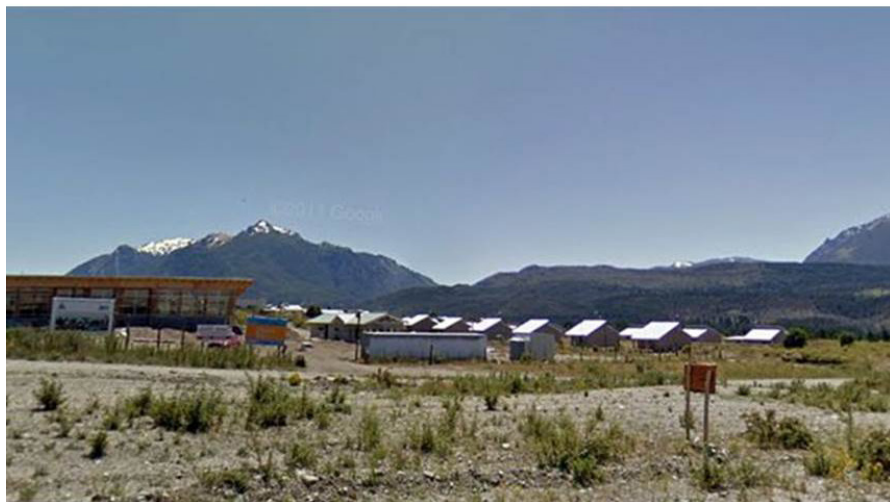
Fig. A. Pueblo de Epuyén en la precordillera chubutense.

En 1996 hubo un brote de Hantavirus en El Bolsón, que fue muy importante en principio porque en Argentina había muy poca experiencia con esta enfermedad, entonces se dispuso pedir asesoramiento a expertos de Estados Unidos, quienes analizaron la situación y brindaron su experiencia, es así que supimos por ej. que la cepa norteamericana no se transmite entre humanos, como sí lo hace la propia de nuestro país y que produce una enfermedad respiratoria con una mortalidad estimada entre el 30 y el 50 %, por lo cual constituye una infección grave.