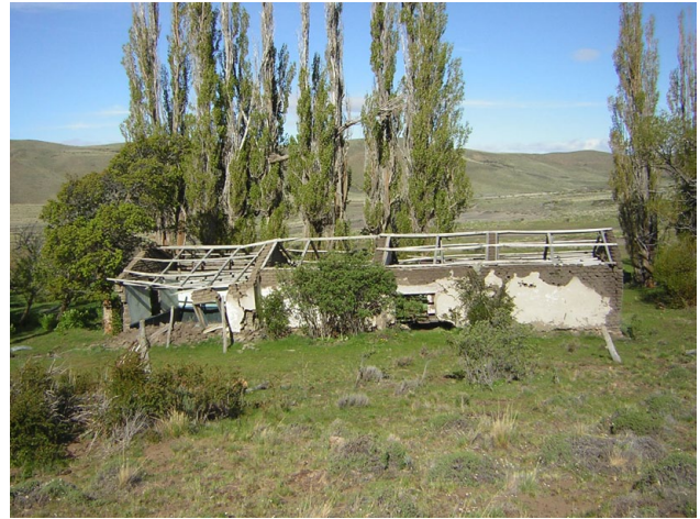
Figura 3: Puesto Grande de la Estancia Roselló.

Al mismo tiempo, la información paleoambiental sumada a los análisis zooarqueológicos de los restos faunísticos de CP1 permitirán considerar si la presencia diferencial de huemul entre los recursos consumidos en los distintos momentos de ocupación de CP1 respondería a cambios en su disponibilidad cercana o a la aplicación de distintas estrategias culturales relacionadas con los circuitos de caza de estos grupos. En este mismo sentido, la presencia de obsidiana procedente de fuentes distantes, permite plantear hipótesis acerca de los circuitos de movilidad de los grupos cazadores recolectores que habitaron el sitio, desde los momentos de ocupación inicial hasta los más tardíos. Para el caso de los sitios indígenas de superficie, se observa preliminarmente un contraste en el tipo de materias primas utilizadas. En CP1, predomina el uso de volcánita ácida local, en cambio esta roca está ausente en los otros sitios de superficie relevados en el área (tanto