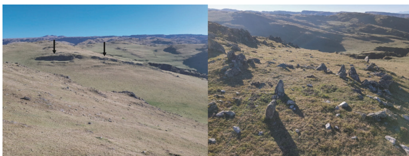
Figure 3: The first image shows the two adjoining structures in the background, while the second is a detail of the standing rocks that make up one of the enclosures.

y/o lugares de vivienda temporales, la necesidad constante de interconexión visual era necesaria.