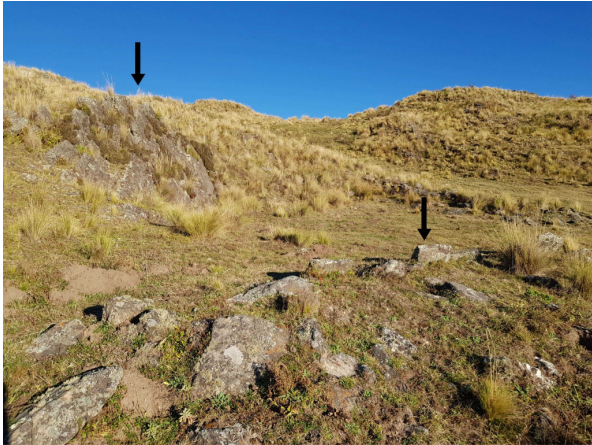
Figura 4: Esta imagen representa uno de muchos ejemplos de la utilización de los afloramientos de roca (flecha superior) para conformar uno de los muros del recinto, seguido de paredes de muro doble de piedra parada (flecha inferior).