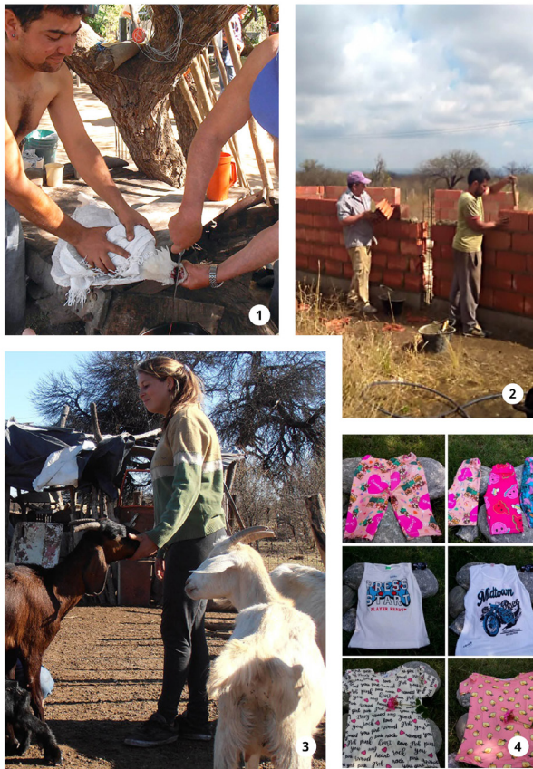
Figura 4. “Economías pluriactivas” [1. Cría y faena doméstica de pollos; 2. Empleo en la construcción; 3. Cría de ganado caprino; 4. Reventa de productos por catálogo], fotografías de la autora y de Matías Pacheco.