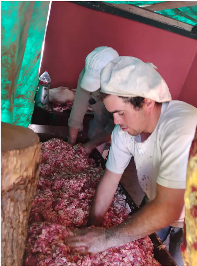
Figura 8. “Elaboración de facturas para aprovisionamiento familiar”, fotografía de Marina Duarte.