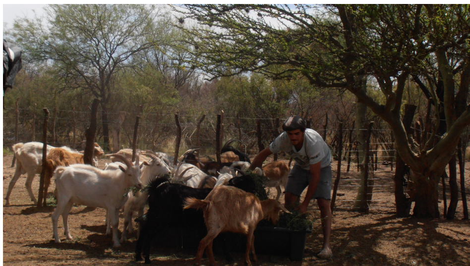
Figura 2. “Ganadería caprina en Traslasierra”.