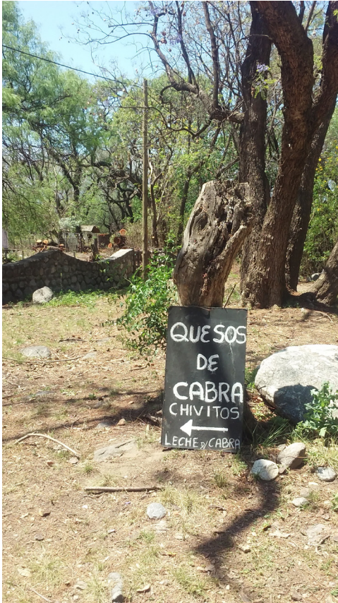
Figura 6. “Comercialización familiar de carne y derivados caprinos”.