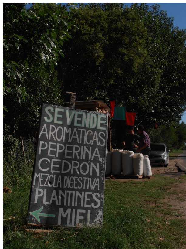
Figure 5. Marketing of regional aromatic herbs (Photograph taken by the author).