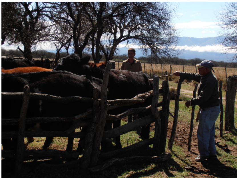
Figura 7. “Ganado vacuno familiar”, fotografía de la autora.