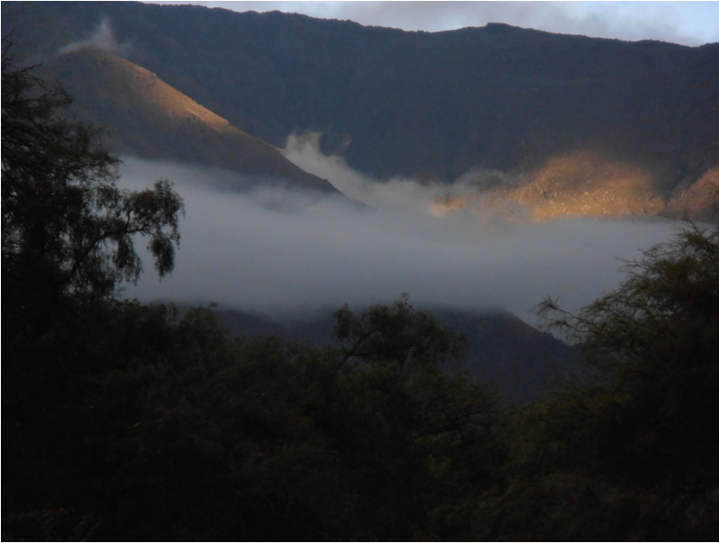
Figura 3. “Paisaje serrano”, fotografía de la autora.