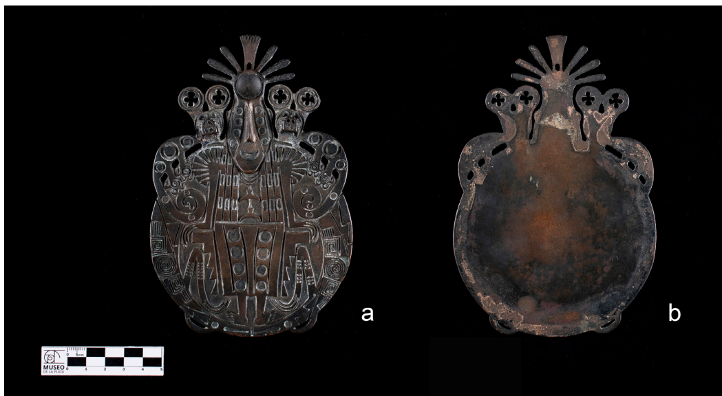
Figura 4: Serie fotográfica compuesta de dos tomas para el disco o caylle de Lafone Quevedo (MLP-Ar-BMB-6791).