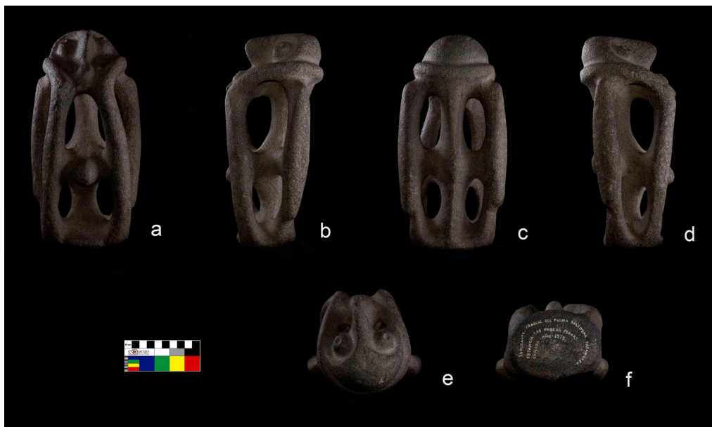
Figure 3: Photographic series composed of six shots for the Balcozna supplicant (MLP-Ar-8391).

la importancia de la estandarización de las tomas: si las fotografías fueron tomadas de forma idéntica, las modificaciones serán igualmente efectivas para todas las imágenes correspondientes a una pieza.