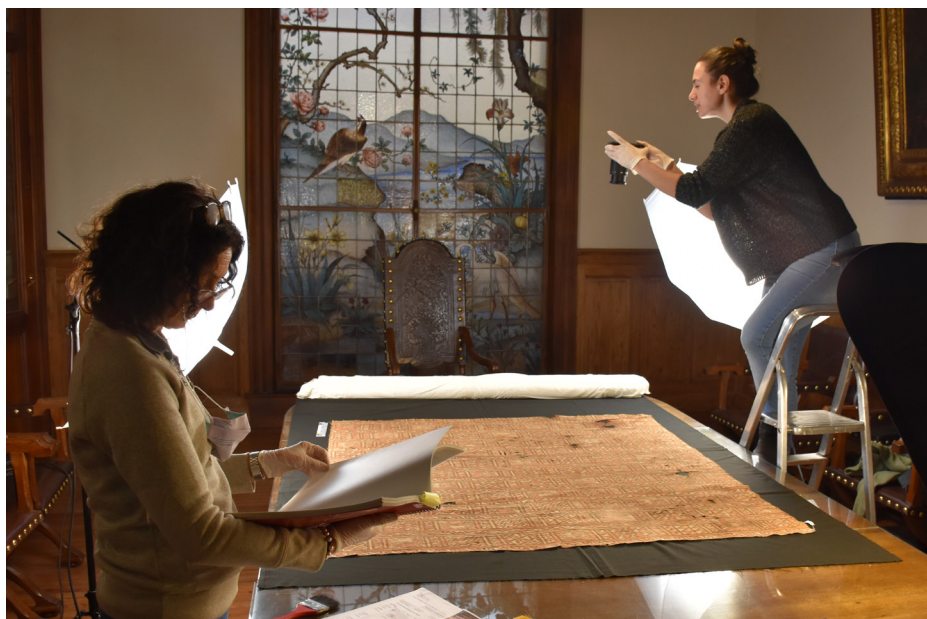
Figura 5: Escena de trabajo en la sala de Consejo del MLP para el registro panorámico de textiles.