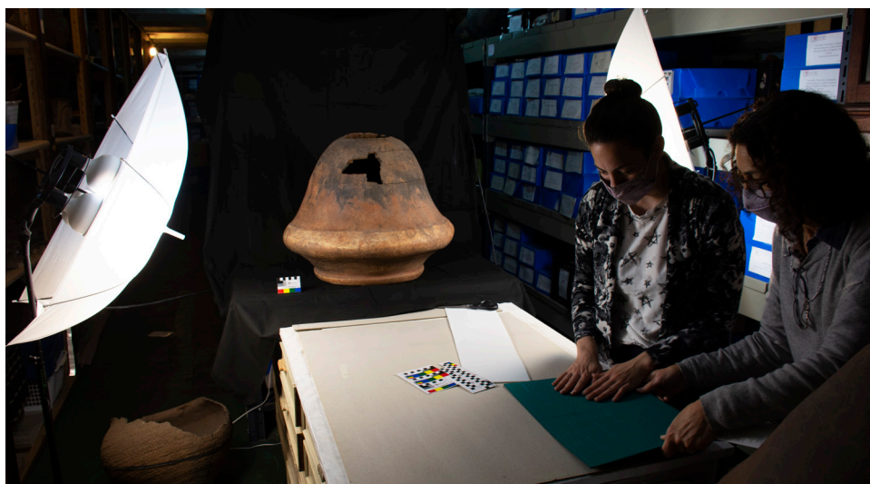
Figura 1: Escena de trabajo durante la pandemia de COVID-19 en el depósito 25 de la División Arqueología.

Para lograr un desarrollo eficiente de las actividades fue necesaria una etapa previa de diseño, planificación y acondicionamiento de los recursos, a través de tres procesos fundamentales. En primer lugar, la estandarización de las pautas técnicas y protocolización del flujo de tareas de las sesiones de registro, lo cual fue producto de numerosas pruebas. En segundo lugar, la obtención de los insumos, materiales y la tecnología básica para alcanzar dichos objetivos. Por último, la capacitación teórico-práctica de quienes iban a realizar el registro mediante dos encuentros formales