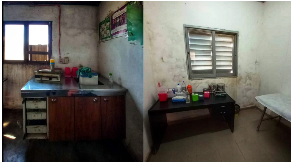
Figure 3: Care and consultation spaces of two Health Centers in Pampa del Indio

antes referido sobre el acceso al agua es una problemática que se traslada a los centros sanitarios y hospitales.