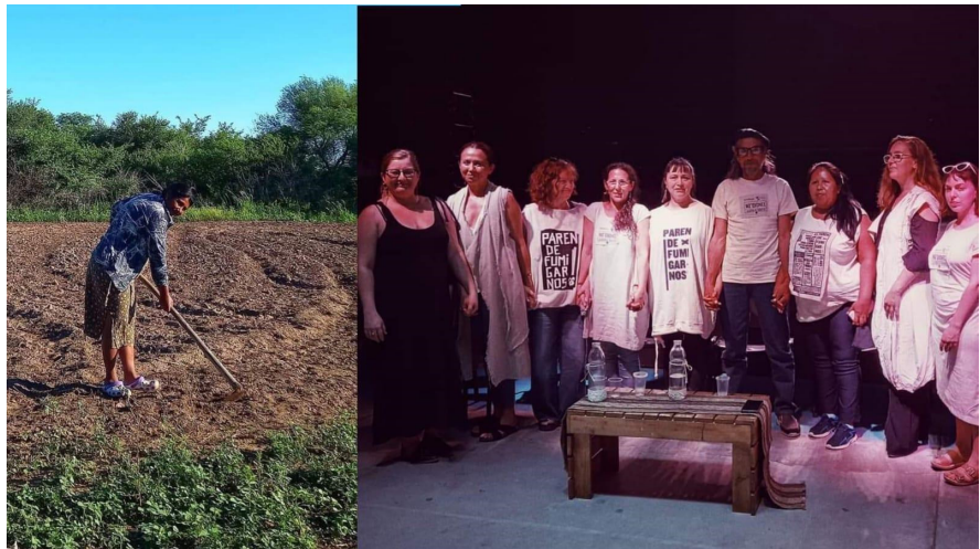
Figure 4: members of NO'OXONEC, Algodón de Frontera

hasta aquí reseñadas fueron la condición de posibilidad para la gestación de estrategias locales tendientes a visibilizar las problemáticas existentes y a crear alternativas sustentables para producir alimentos, en contraposición al modelo de producción convencional (Altieri y Toledo, 2010; Toledo, 2011; Giraldo, 2018). En dicho escenario, la organización de integrantes de comunidades indígenas y pequeños productores hizo posible transformar territorios que estaban siendo desarticulados y deshabitados producto del avance del agronegocio y el acaparamiento de bienes comunes, a espacios de resistencia y habitabilidad sana y comunitaria. En Chaco, diversas investigaciones vienen explorando la emergencia de agroecologías "en plural" junto con los diversos y contradictorios procesos de transición agroecológica (Barbetta, 2020; Serpe, 2023).