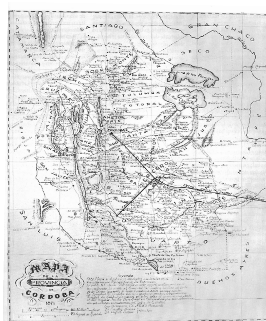
Figura N°2 Mapa Oficial de la Provincia de Córdoba 1871.