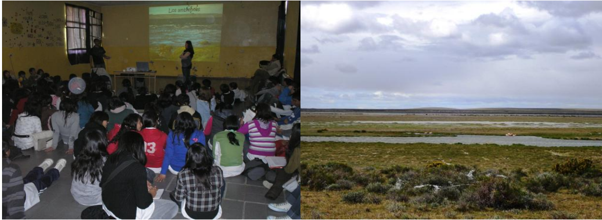
Fig. 2. Visita del Centro Interpretación Ambiental a las instalaciones del colegio donde brindaron una charla informativa sobre el Ambiente Costero en nuestra ciudad, durante el mes de octubre de 2014. A la derecha vista panorámica de un sector del humedal en Río Gallegos, durante el mes de junio del mismo año.