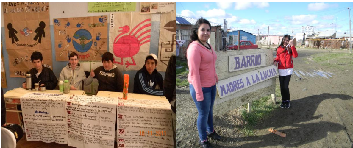
Fig. 3. Uno de los Stand armado para la muestra anual que se realiza en el colegio durante el mes de noviembre de 2014, donde todos los profesores presentan los trabajos más significativos del año. A la derecha salida de campo de un grupo de alumnas al Barrio “Madres a la Lucha” a metros del Humedal, tomada en el mes de julio de 2014.