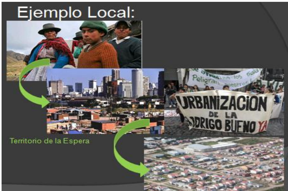
Figura N° 3: Ejemplo local territorio de espera