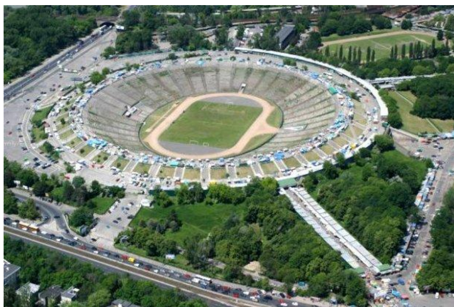
Figura N° 9: Feria ilegal en un ex estadio de fútbol en Jarmark, Polonia.