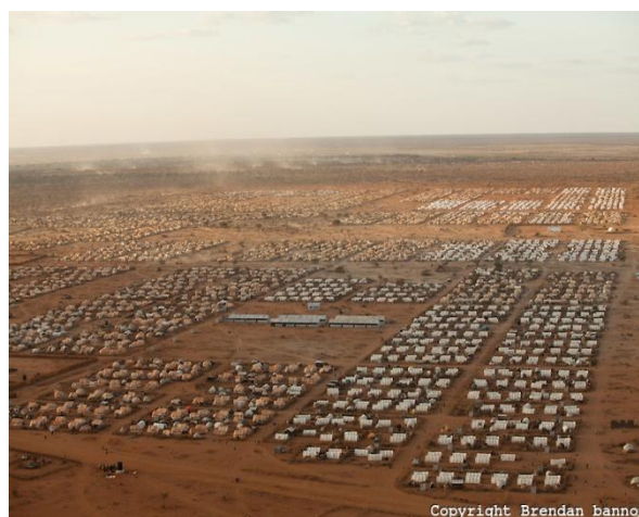
Figura N°6: Vista aérea oblicua alta del Campamento de Refugiados políticos en Melkadida, Sudeste de Etiopía

Un caso para analizar son los Campos de Refugiados , aquí llegan miles de personas que son localizados por diversos motivos (ya sea, por cuestiones ambientales, políticas, religiosas, etc). Los campos de refugiados son espacios planificados, pero el habitar establece una territorialidad entre sus ocupantes. Son ocupaciones que están cruzadas por la incertidumbre, o sea una espera que no se sabe cuándo puede terminar. Existen muchos casos de campos de refugiados, veamos a continuación un ejemplo en Etiopía.