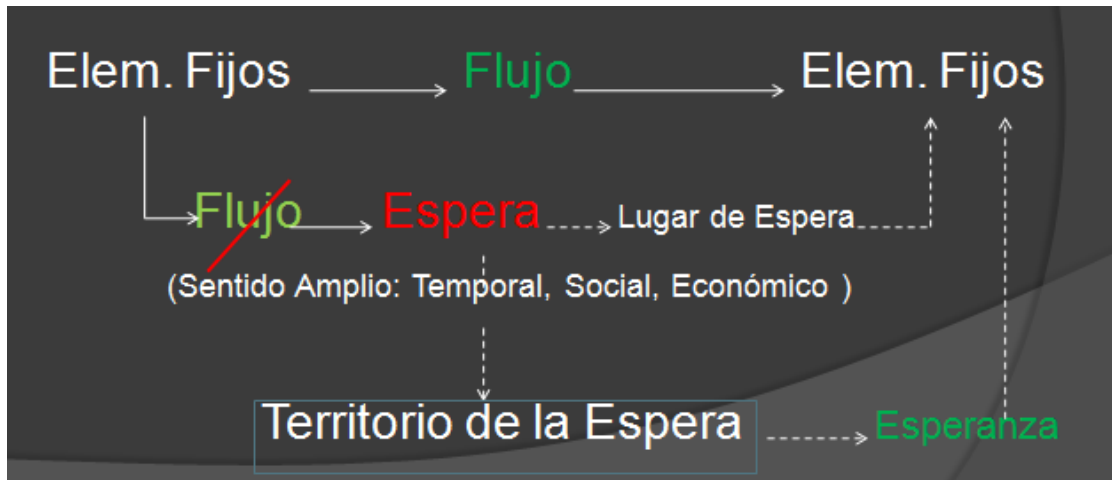
Figura N° 2: Relación Elementos Fijos, Flujos, Territorio y Espera

etc. Un ejemplo de detención del flujo entre fijos serían: demoras ocasionadas en escalas aeroportuarias, interrupción del tránsito en los puestos fronterizos.