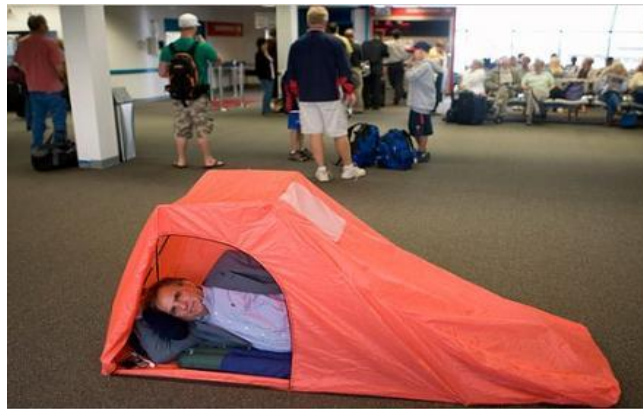
Figura N°4: Caso extremo donde se observa un individuo apropiándose de un espacio vital para sobrellevar la extensa espera

de vuelo; hay un uso de un espacio vital en la espera; se establecen competencias territoriales; y existen historias personales y sociales durante una espera.