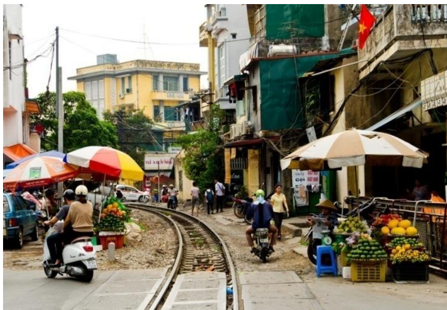
Figura N° 8: Feria ilegal de “Street Food” en Hanoi, Vietnam.