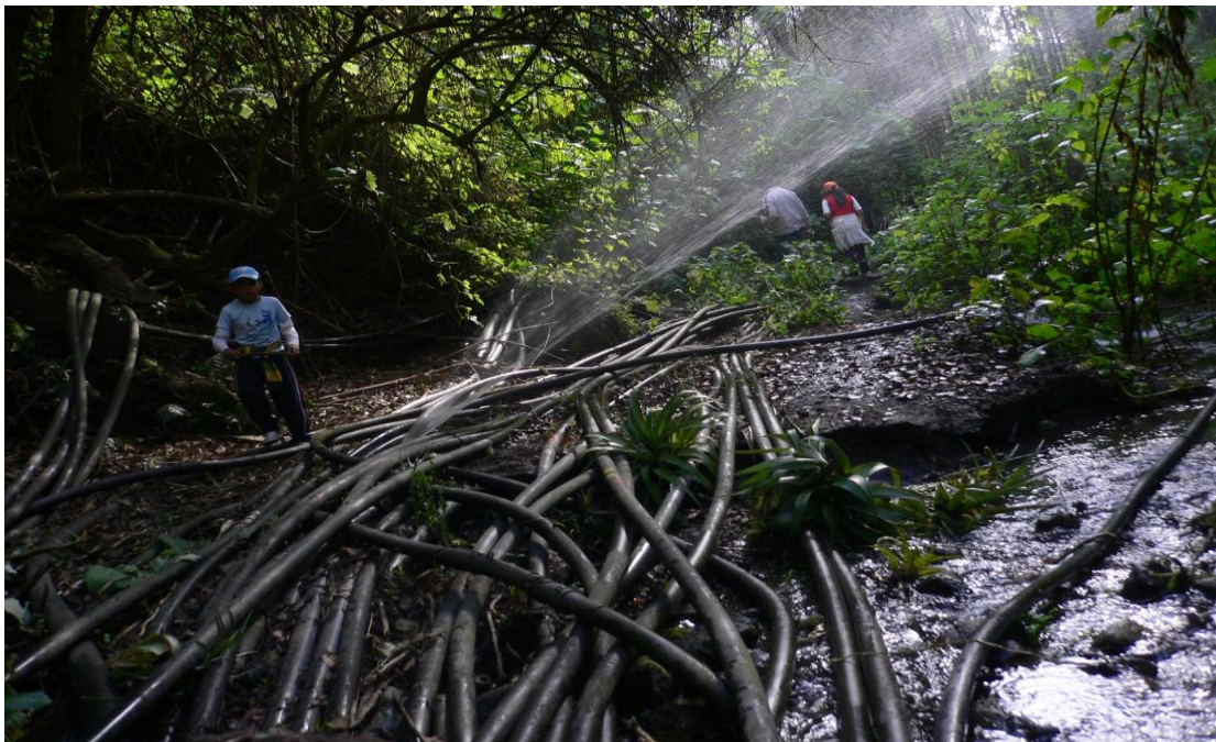
Figura 3. Cruce de mangueras para riego en el río Amatzinac