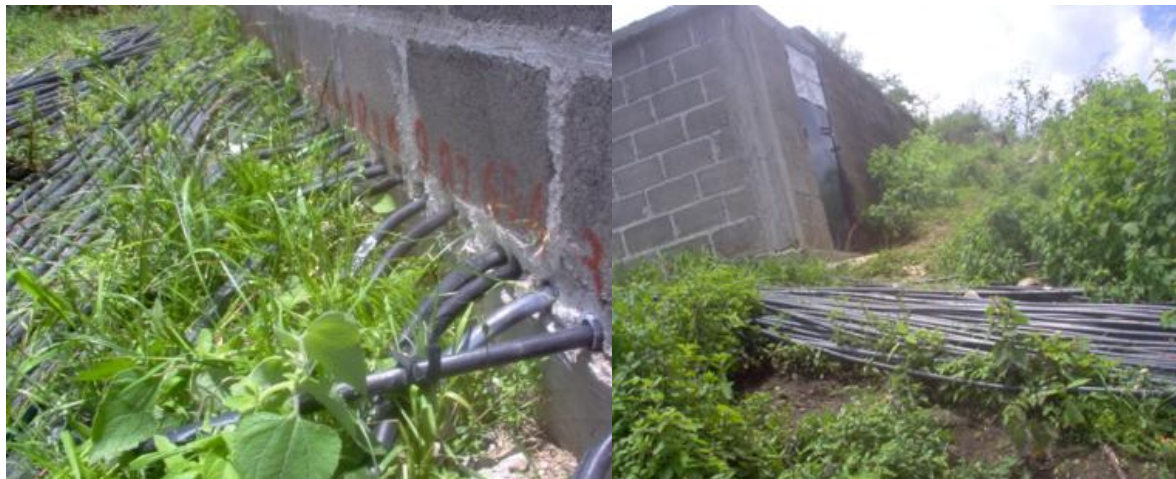
Figura 4. Tomas para uso doméstico de una caja de agua

Al igual que en el caso de las mangueras, las cajas de agua son administradas por familias pudientes, y que han contado con cierta autoridad moral y política en la historia reciente de la localidad. Los pobladores entrevistados se refieren al uso colectivo del agua para fines domésticos como algo que ocurre con claridad, por lo menos, desde 1926 (Guzmán, 2012); en ese entonces se trataba de grupos de pobladores organizados para el uso de apancles (canales o corrientes de agua), conocidos localmente como presas , ya que generalmente levantaban obstáculos para levantar el nivel del agua y poder tomarla para su acarreo. Posteriormente, estos usuarios construyeron estructuras de cemento para cubrir el nacimiento o fuente, y conectaron una tubería que traslada el agua desde ese lugar hasta las casas de los integrantes del grupo, y las nombraron cajas de agua , que se construyeron cisternas para su almacenamiento y distribución. A veces el líquido se distribuye en contenedores intermedios, y otras, va directamente de la zona habitacional. A mediados de la década del 1960, se construyeron más cajas de agua hasta llegar aproximadamente a 15, según los testimonios, y de 2000 a la fecha se multiplicaron al grado de que los mismos habitantes desconocen cuantas existen, aunque aseguraron que son más de 25 (Bastian y Vargas 2015).