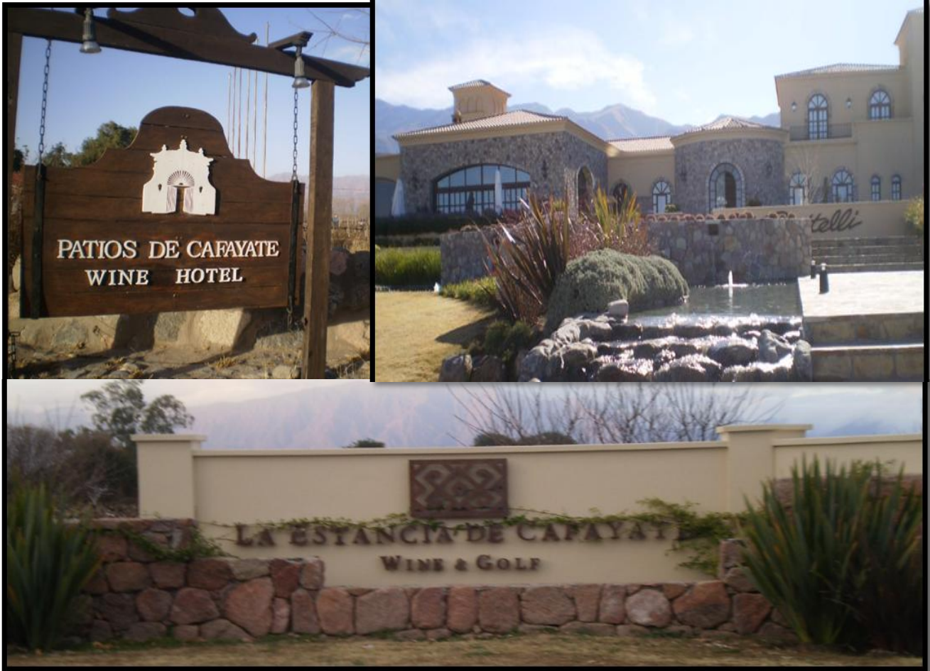
Figuras N° 3: “Proceso de sofisticación del valle Calchaquí de Salta”