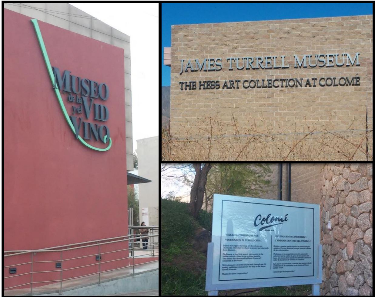
Figura N° 4: “Vanguardismo enológico como atractivo turístico”