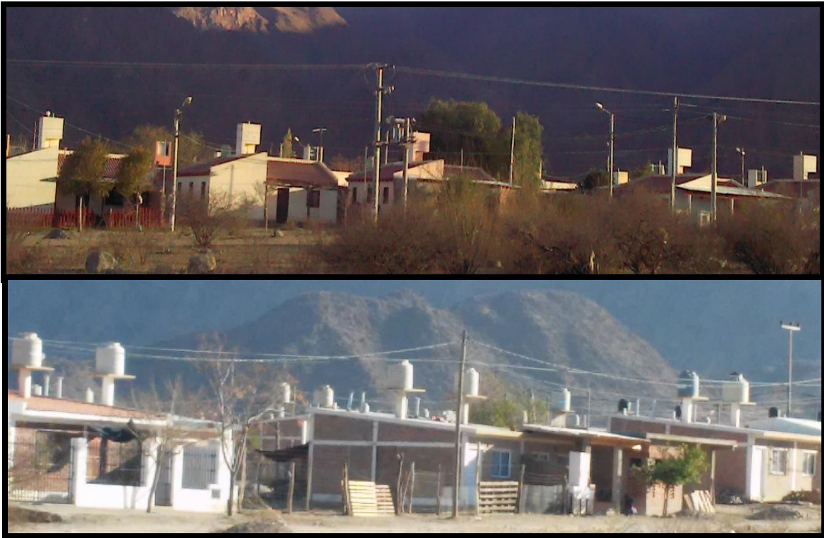
Figuras N° 5: “Nuevos barrios en las afueras de Cafayate”