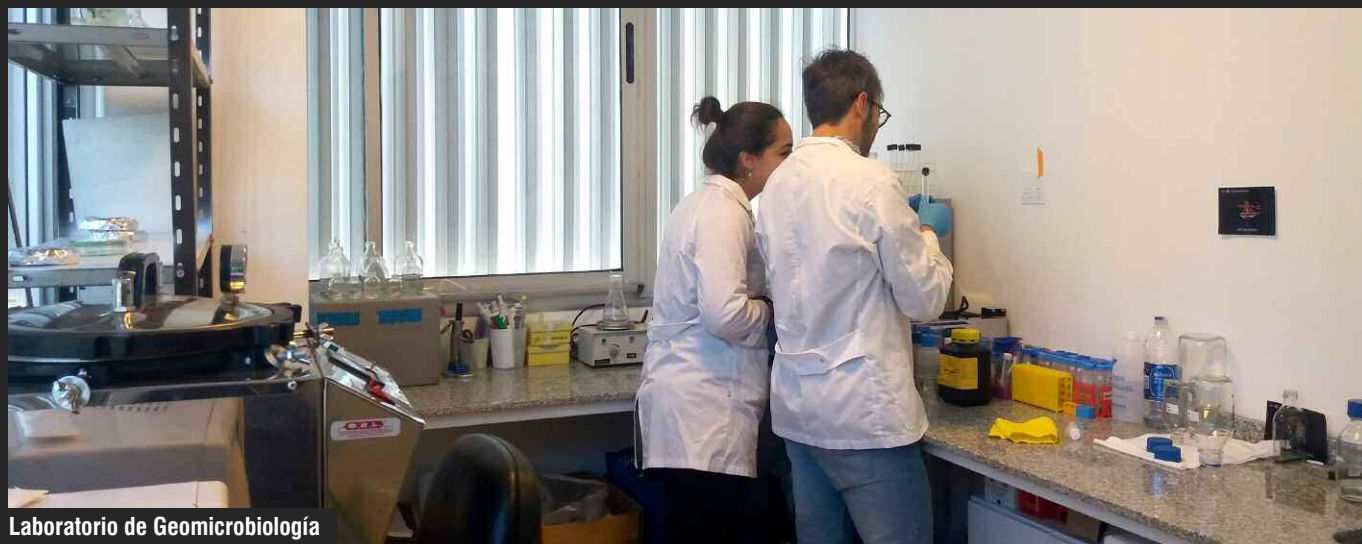
Laboratorio de Geomicrobiología

proviene del estudio de los fósiles) como neontológicos (que provienen de estudiar las formas vivientes). En vertebrados también se busca el llamado correlato óseo, esto es, la marca que dejan algunos músculos sobre los huesos. A partir del correlato óseo preservado en el fósil y en contraste con su par actual, es posible predecir la función que ejercería ese músculo en el animal extinto. Actualmente, uno de los focos principales es la reconstrucción de tejidos blandos, especialmente de la cabeza (músculos, cerebro y oído, por ejemplo) y del miembro posterior en vertebrados tetrápodos. Para ello, se