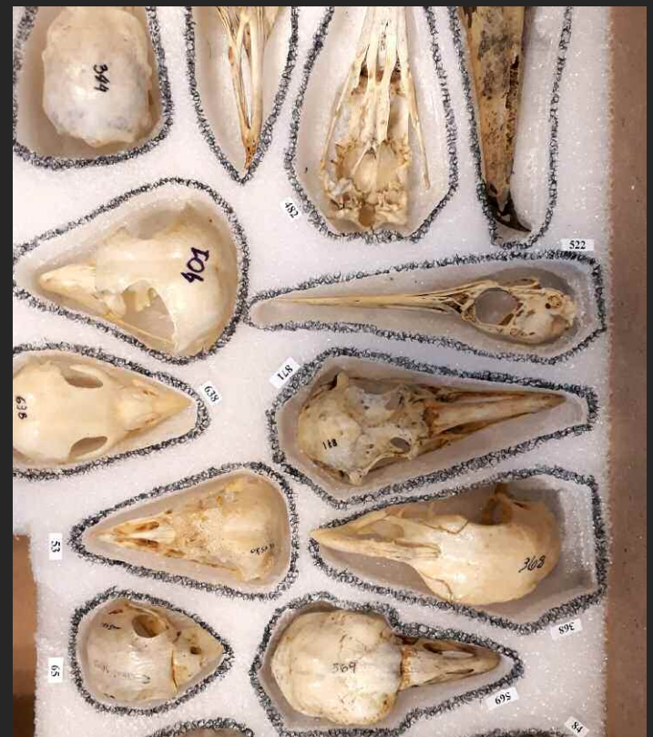
Cráneos de aves