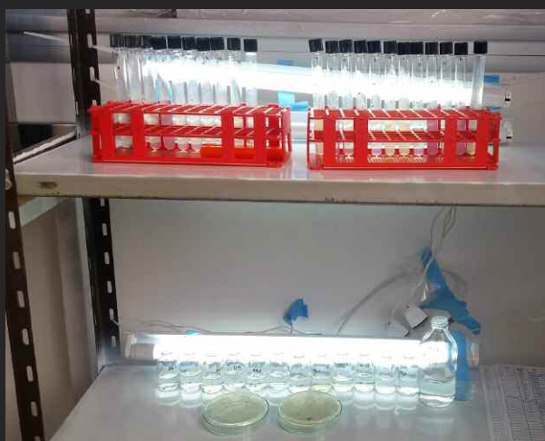
Cultivo de cianobacterias