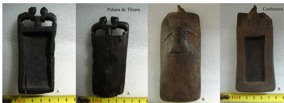
Figura 3. A. Tableta procedente del Pukara de Tilcara (N° 2227), con una cabeza humana coronada con dos felinos a cuerpo completo. B. Tableta procedente de Cochino (N° 1945) cuya decoración asemeja a un cóndor.

con la representación de un camélido y un hombre sosteniendo un hacha mientras toca una trompeta (Nielsen 2007b). En esta misma dirección Sprovieri (2008-2009), en su estudio sobre las tabletas y tubos del Valle Calchaquí, destaca la presencia de un tubo de madera, procedente de Cachi, decorado con una figura humana con máscara zoomorfa (felino), la cual sostiene en sus manos una cabeza trofeo y un hacha.