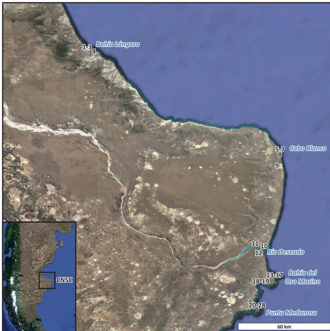
Figura 1. Ubicación de los sitios arqueológicos con especímenes avifaunísticos en la Costa Norte de Santa Cruz. Referencias: 1) Palo Alto; 2) Palo Caído; 3) Puente de Hierro; 4) Sitio Moreno, comp. 1; 5) Cabo Blanco 1; 6) Cabo Blanco 2; 7) El Piche; 8) Laguna del Telégrafo; 9) Médanos del Salitral; 10) UNPA; 11) Alero 4; 12) Puerto Jenkins 2; 13) Playa del Negro; 14) Cueva del Negro; 15) Las Hormigas; 16) Los Albatros; 17) Alero El Oriental; 18) Sitio 112; 19) Isla Lobos; 20) Sitio 160; 21) Médano 1; 22) Punta Buque; 23) Puesto Baliza 1; 24) Puesto Baliza 2; 25) Punta Medanosa 1; 26) Punta Medanosa 2; 27) Punta Medanosa 3; 28) Punta Medanosa 4.

algunos muestreos se observó la presencia de indicadores antrópicos, especialmente de huellas asociadas al procesamiento y consumo humano, principalmente marcas de corte (Laroulandie 2005; Lyman 1994; Miotti 1990-1992; Marani y Borella 2014). En la mayoría de los casos se empleó la información publicada y, en unos pocos, los datos disponibles en los trabajos de investigación del proyecto marco que aún no se encuentran publicados.