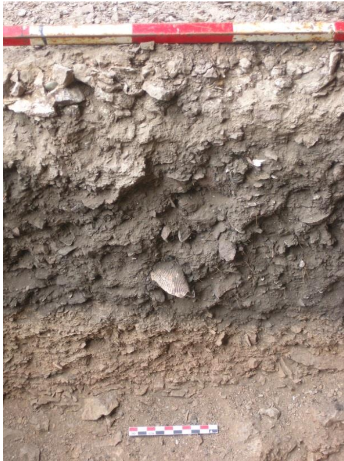
Figura 2. Contexto estratigráfico del sitio Alero 4. En color gris oscuro se observa la matriz sedimentaria que contenía el componente ocupacional del sitio.