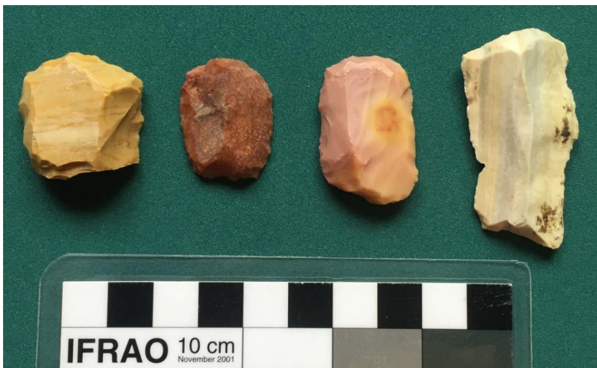
Figura 3. Algunos de los raspadores confeccionados sobre materia prima no local identificados en el sitio Alero 4.