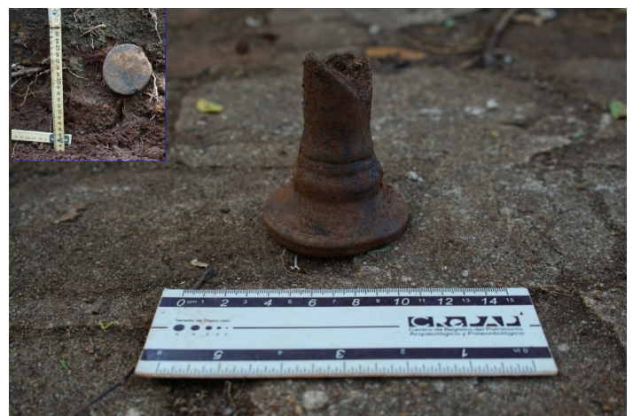
Figura 8. Primer candelero recuperado y detalle de su ubicación en el perfil de Concep 7.

De los restos materiales recuperados que más llamó la atención fueron dos candeleros, definidos como elementos fabricados para sostener una vela, apoyados sobre un plano horizontal (Schavelzón 2014). Los mismos fueron encontrados en el sector A de Concep 7. El primero se encontró mientras se limpiaba el perfil del muro (pared E), a unos 32 cm de profundidad del nivel 0. El mismo se hallaba en forma horizontal, sobresaliendo su base circular en el perfil (Figura 8). A la misma altura se descubrió un artefacto similar, junto a fragmentos sueltos que eran parte del mismo (Figura 9).