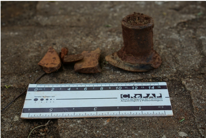
Figura 9. Segundo candelero recuperado junto a fragmentos del mismo.

El primer candelero tiene un espesor máximo en su base de de 7,5 cm, mínimo de 3,3 cm, altura de 9,4 cm y ancho de 7,7 cm. Realizados en material cerámico, presenta una base circular y en su centro un soporte de forma cilíndrica en donde se llevaba la vela. Tiene una coloración oscura.