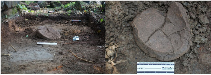
Figura 10. Base de vasija recuperada en Concepción 7, sector C.