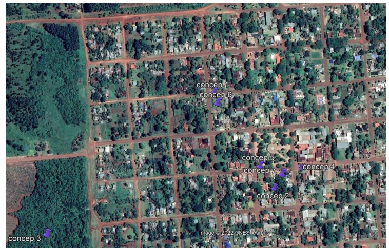
Figura 3. Áreas excavadas del casco histórico del pueblo.

Se realizaron sondeos exploratorios en los lugares seleccionados a partir de la superposición de planos, buscando una primera