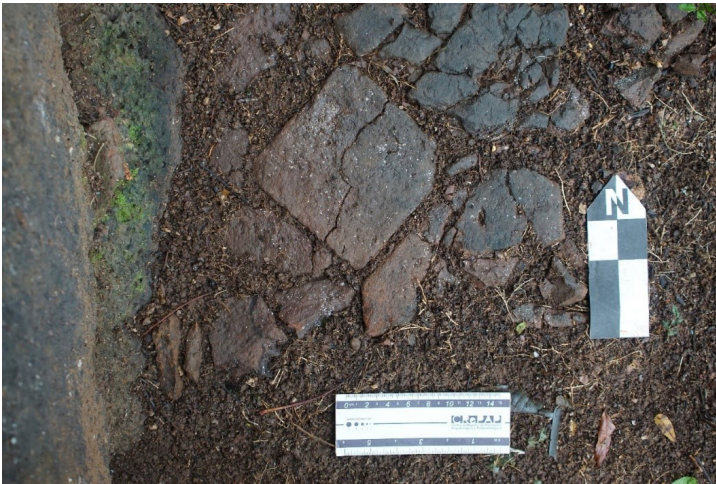
Figura 7. Sector C con baldosas en superficie.

observar en la superficie (Figura 7). Se excavó hasta unos 50 cm de profundidad de forma pareja en toda el área. Al igual que en los sectores anteriores, como medida de conservación se tapó todo con la tierra removida, quedando el lugar limpio y con la menor alteración posible.