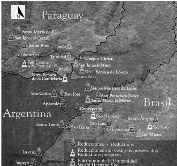
Figura 1. Reducciones jesuíticas y ubicación de la reducción de Concepción.

con San Nicolás, San Francisco Xavier y Yapeyú en el año 1626, Nuestra Señora de la Candelaria y Nuestra Señora de la Purificación en 1627, y Asuncion de Yjuhí y Todos los Santos de Caaró en 1628 (Martínez Cañavate 2017) (Figura 1).