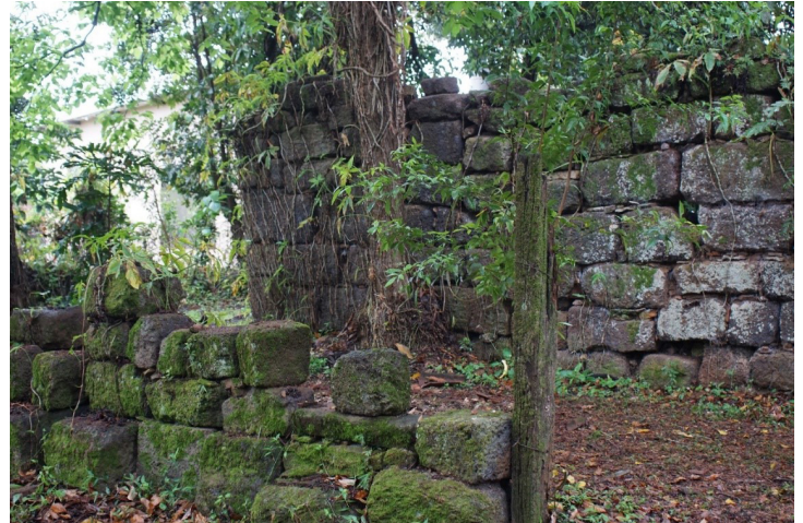
Figura 6. Ubicación del sector B.

El sector B se definió a unos 6 metros al Sur del sector A, en un área cubierta de vegetación limitado en su lado norte por el muro de la estructura principal, y en sus lados Oeste y Sur por muros de unos 84 cm promedio de altura realizados en rocas itacurú (Figura 6).