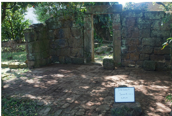
Figura 5. Estructura y ubicación del sector A.

Se excavaron hasta 50 cm, y se subdividió el área en un sondeo de 50 x 50 cm para excavar unos 10 cm más y poder observar la tierra negra, o el nivel donde ya no salía material.