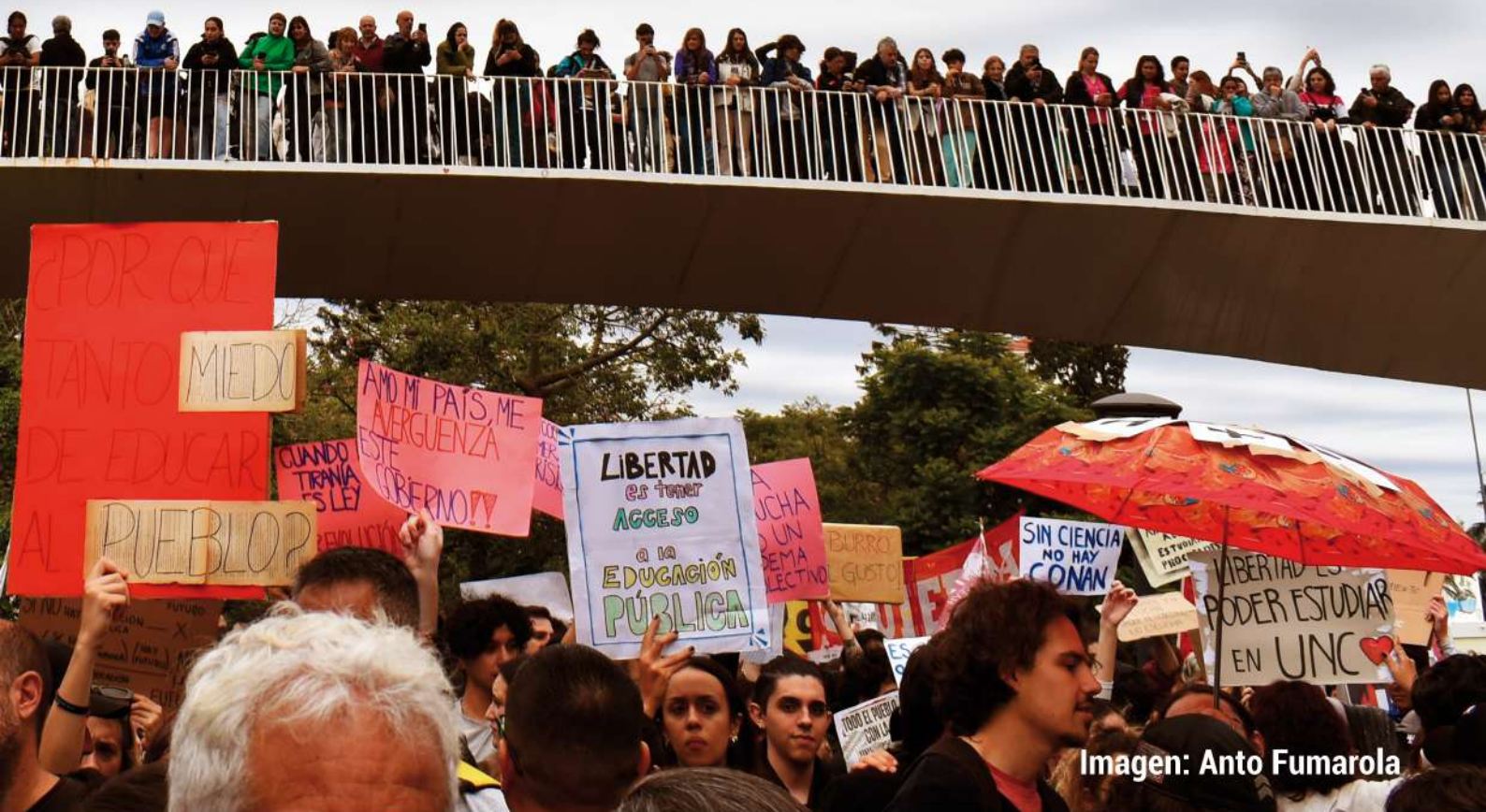
Imagen: Anto Fumarola

Reflexiones de la lucha universitaria desde la Facultad de Ciencias Sociales (UNC)