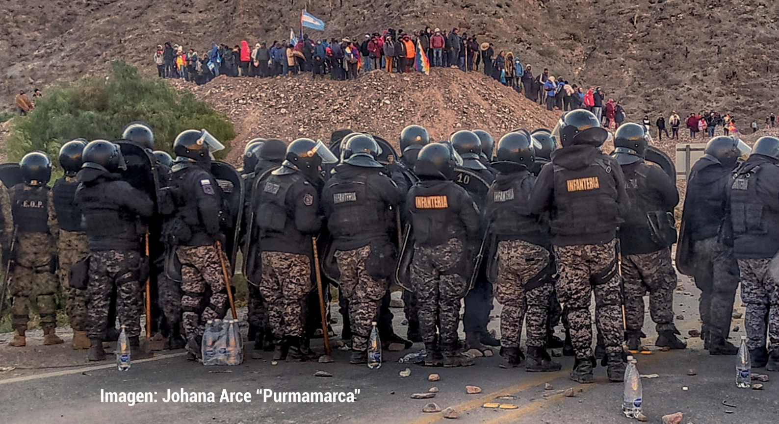
Imagen: Johana Arce "Purmamarca"