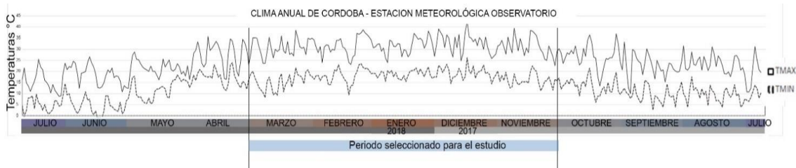
Figura 1: Gráfico de temperaturas anuales de Córdoba Capital – estación meteorológica Observatorio (julio 20a Julio 2018)