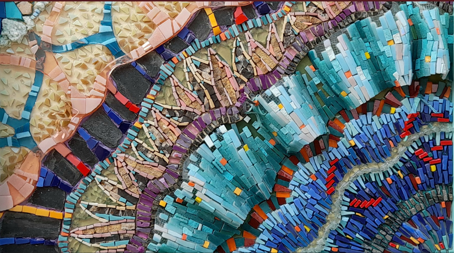
Ágata (2019) · Cecilia Rodríguez · Mosaico