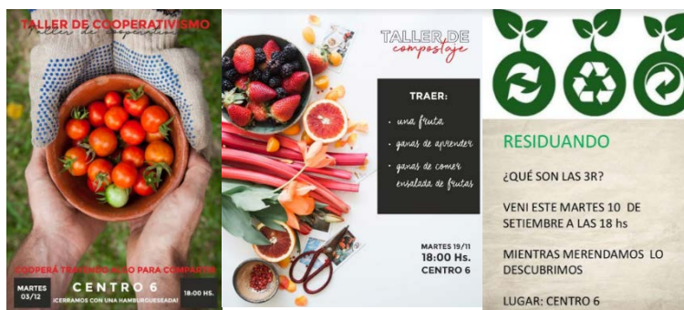
Figura 1. Invitaciones a los talleres.

sociales y en forma verbal. En la figura 1 se muestran algunas de las invitaciones. Asistieron un promedio de 30 personas, de variada edad (14 - 65 años) y variado contexto, con una notoria mayoría de mujeres, evidenciando que los problemas ambientales son principalmente de interés para ellas. La metodología propuesta en los talleres consistió en una actividad disparadora del tema de cada taller y a partir de allí, trabajando en grupos, encontrar posibles soluciones locales. De esta forma, al hacer una caracterización de la problemática en la zona y ellos buscar posibles soluciones, se logró que ellos se apropiaron de su realidad.