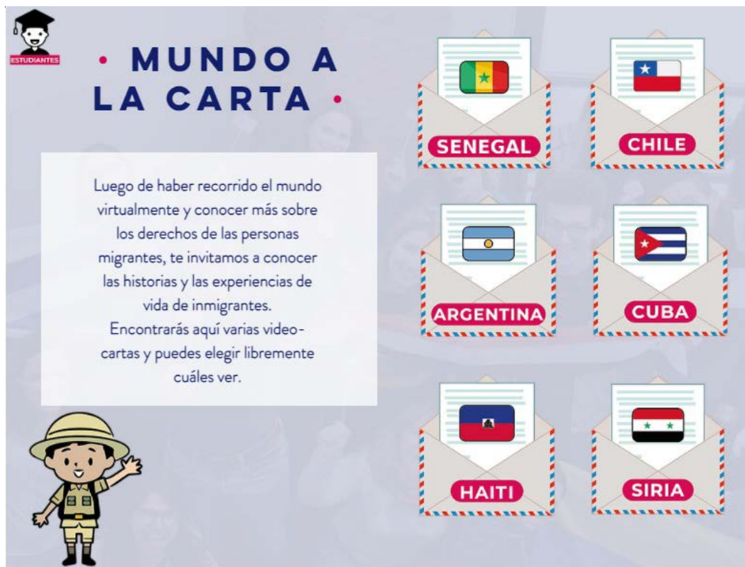
Figura 4. Video cartas migrantes.