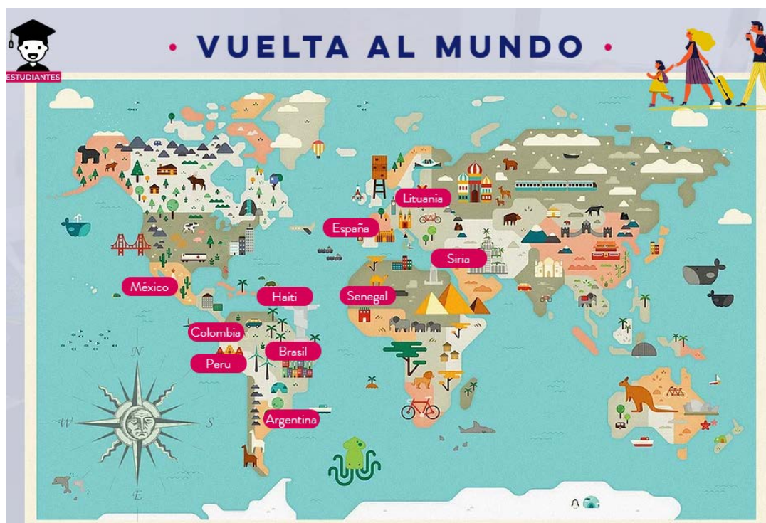
Figura 2. Recorrido virtual por los países participantes.

Primer momento: La vuelta al mundo. Una versión virtual e interactiva de una feria de naciones donde se pudo navegar por los distintos países y sus culturas. Las y los voluntarios migrantes expusieron sus culturas ante la comunidad escolar, cada participante desarrolló un recorrido virtual para exhibir los elementos más relevantes que pretendieron compartir, acompañados con curiosidades para promover la interacción y juegos para crear un desafío virtual de “sellar el pasaporte online” para recorrer el mundo. Esta interacción se realizó mediante la herramienta virtual Genially , utilizando la metodología breakout para que pudieran explorar varios aspectos viajando de un sector del país al otro.