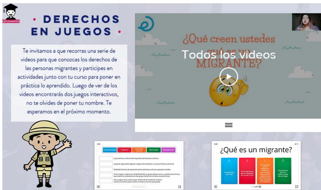
Figura 3. Derechos en juego: una serie de videos y juegos interactivos sobre derechos migrantes.

diseñadas mediante videos cortos, interactivos donde miembros del equipo generaron contenidos invitando al estudiantado a realizarse preguntas reflexivas sobre la migración, para que luego las y los participantes pudieran compartir sus respuestas en plataformas de trabajo colaborativo como Padlet.com y Menti.com . Luego se compartieron juegos interactivos poniendo en práctica los conceptos trabajados en este momento.