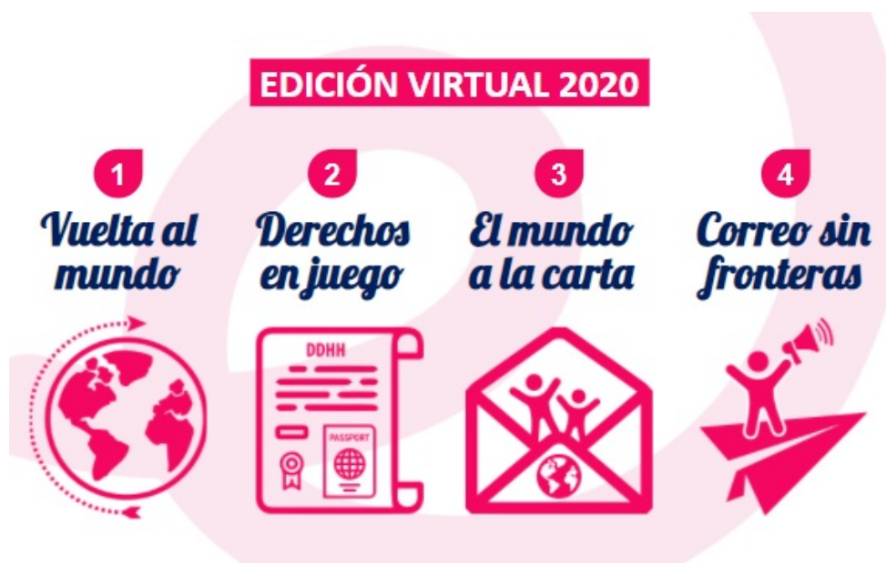
Figura 1. Cuatro momentos virtuales en la web

La experiencia virtual del proyecto se organizó en cuatro momentos: