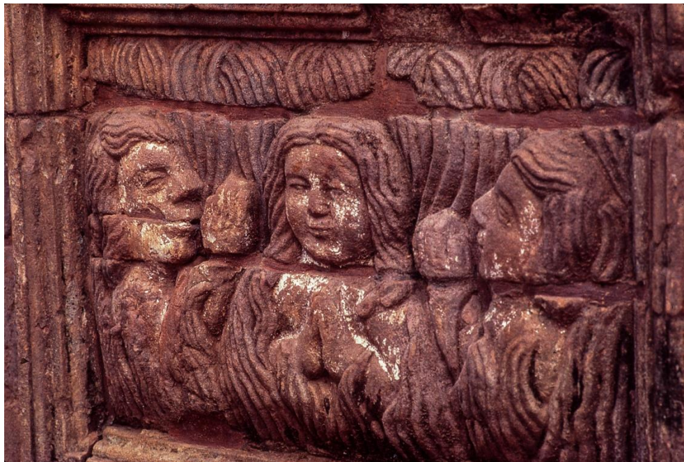
Fig. 1. Tres figuras entre llamas. Antependio del altar de ánimas, Trinidad.