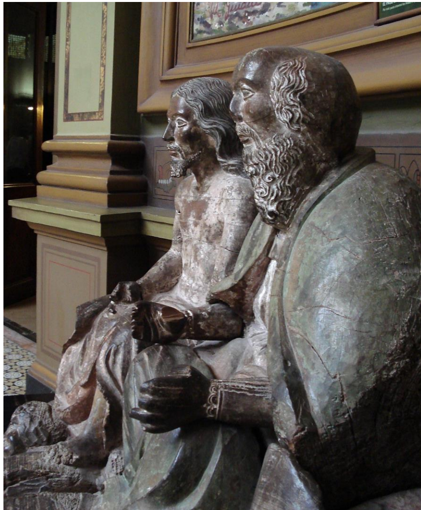
Fig. 6. Imágenes de Padre e Hijo. Museo de la Plata.

(1932, p. 203) 24 . No hay manera de saber el emplazamiento original de esta talla colectada por Bourgoing en Trinidad. No obstante, dado que en la iconografía de las ánimas en el Purgatorio la figura de San Miguel Arcángel usualmente adquiere centralidad en su rol de intercesión, podemos considerar factible que la imagen de cedro conservada en La Plata haya formado parte de la composición del altar lítico. Federico Zuccari concede particular destaque a los mediadores alados de su Purgatorio ( Cappella degli Angeli , Iglesia del Gesù, hacia 1591). En el Purgatorio de Quispe Tito el arcángel observa piadosamente a las almas sufrientes; su mano izquierda apunta a lo alto, indicando la bienaventuranza que aguarda una vez