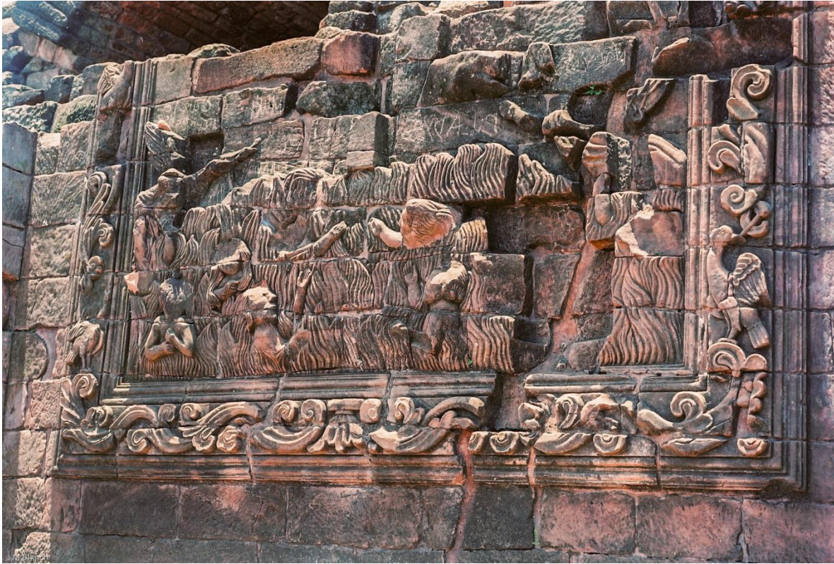
Fig. 3. Almas en purificación. Relieve principal del altar de ánimas, Trinidad.