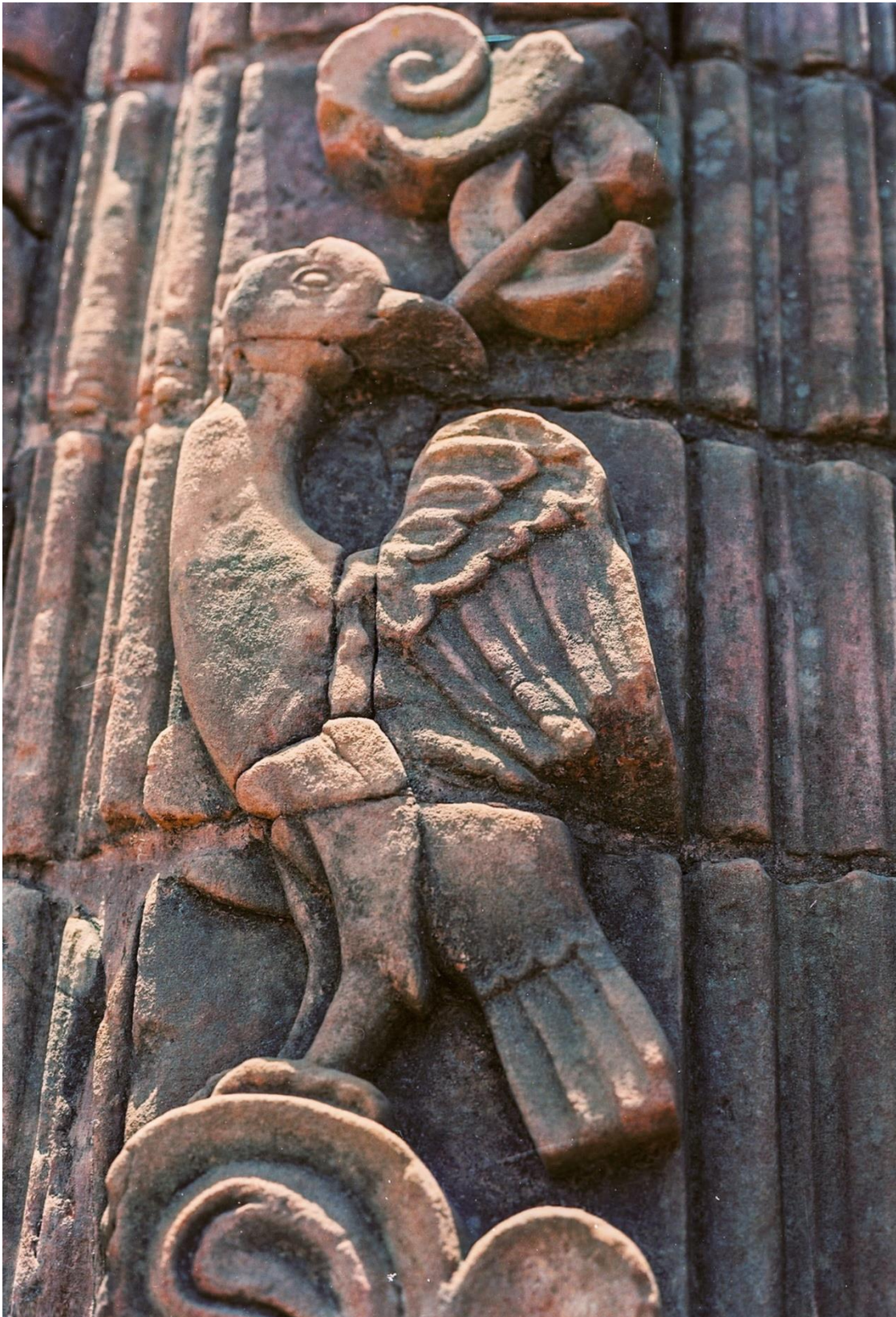
Fig. 2. Decoración zoomórfica en el marco moldurado del altar de ánimas, Trinidad.