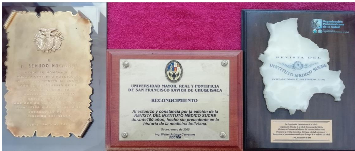
Ordenanza Municipal N° 198/04 y Placa de reconocimiento.

8.- El Colegio Médico de Bolivia otorga una placa de Reconocimiento en el Centenario de la Revista Médica Sucre, por su incesante contribución científico-académica, en beneficio de los galenos de Bolivia. Tarija febrero de 2005 -Placa de reconocimiento-.