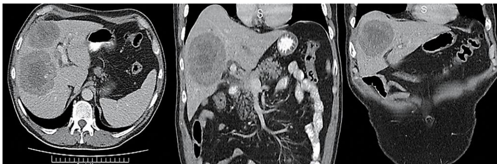
Figura1. Tomografía computada de abdomen realizada al momento del diagnóstico de la patología hepática

Los marcadores oncológicos (Ca 19-9, alfa feto proteína, CEA) y la serología para virus hepatotropos (Virus Hepatitis A, B y C, Citomegalovirus, Epstein Barr) se encontraban dentro de parámetros de normalidad. Se realizó TC de cerebro, TC de tórax y centellografía corporal total; que no evidenciaron lesiones sugestivas de neoplasia primaria o metastásica.