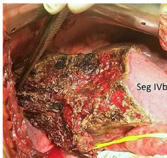
Figura 3. Fotografía intraoperatoria en donde se puede visualizar el remanente hepático (segmentos hepáticos II, III, y IV b).

El paciente cursó el postoperatorio inmediato en la Unidad de Cuidados Intensivos, a las 72 horas fue trasladado a sala común y a los 10 días de postoperatorio fue externado sin complicaciones inmediatas.