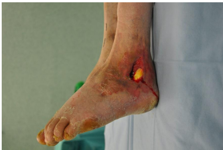
Figura 1. Defecto de partes blandas sobre zona maleolar.

Se trata de un varón intervenido en 13 ocasiones en la extremidad inferior izquierda por unos pies cavos congénitos, que finalizó su tratamiento con un clavo de artrodesis retrógrado tibio-talo-calcáneo. El paciente presentaba un defecto de partes blandas sobre la zona posterior del maléolo externo (figura 1).