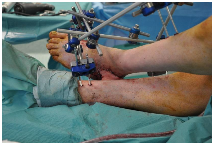
Figura 2. Montaje del fijador externo una vez realizado el colgajo.

Al paciente se le colocó un catéter de anestesia epidural, y el fijador externo fue mantenido durante 3 semanas, cuando se procedió a la retirada del mismo y sección del pedículo del injerto (figura 3).