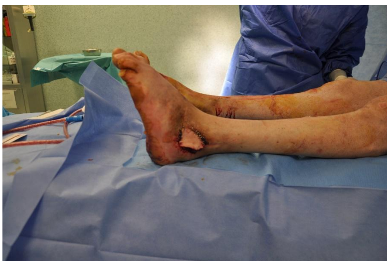
Figura 3. Zona receptora del colgajo tras la sección del pedículo del injerto.

Al paciente se le colocó un catéter de anestesia epidural, y el fijador externo fue mantenido durante 3 semanas, cuando se procedió a la retirada del mismo y sección del pedículo del injerto (figura 3).