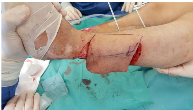
Figura 5. Diseño y realización del colgajo.

Esta intervención se llevó a cabo de manera similar a lo anteriormente expuesto tras la retirada del tornillo y el injerto óseo no viable, con la colaboración conjunta y simultánea de cirujanos plásticos y traumatólogos, se realizó la colocación de fichas y el colgajo a la vez (figura 5), y tras la sutura del colgajo sobre su lecho se finalizó la fijación externa (figura 6), que se mantendría durante 3 semanas hasta la sección del pedículo del injerto. En este caso también se usó catéter epidural, y la paciente volvió a deambular sin necesidad de una rehabilitación específica, tras un periodo de deambulación asistida con muletas.