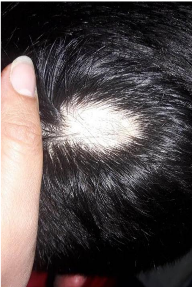
Figura 1. Cuero cabelludo con parche oval de piel sin pelos, en zona del vertex, de 3 cm de longitud mayor.

Se trata de un varón de 24 años que consultó por pérdida espontánea y circunscrita del cuero cabelludo. No refirió antecedentes patológicos de interés. Al examen físico se detectó índice de masa corporal 33,4 m/kg 2 y cintura abdominal 119 cm. En la cabeza se detectó zona oval de piel sin pelos, en zona del vertex, de 3 cm de longitud mayor. Se notaron pelos entrecortados en la periferia semejando signos de admiración (figura 1).