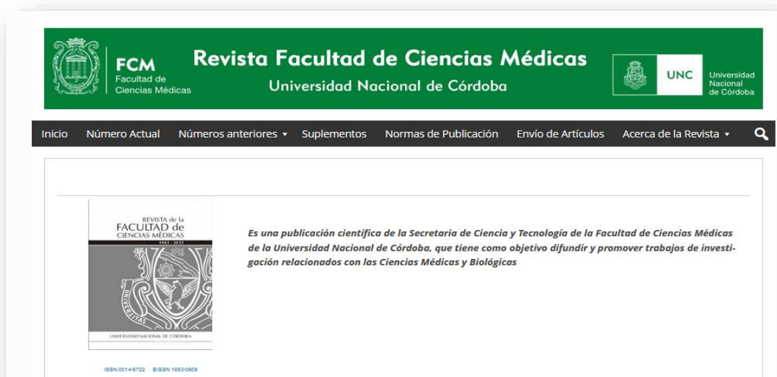
Figura N°3. Interfaz utilizada desde el año 2015-2016.

En el año 2016 también, la revista fue incluida en el Núcleo Básico de Revistas Científicas Argentinas (NBRA) - CAICYT, lo que posibilitó reafirmar su relevancia en el ámbito científico nacional e internacional.