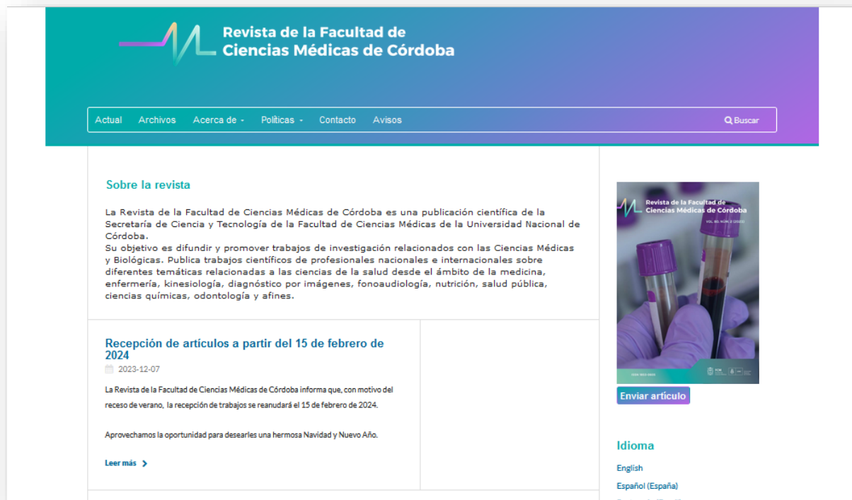
Figura N° 7. Apariencia actual (desde abril 2023) de la Revista de la Facultad de Ciencias Médicas de Córdoba.

En conclusión, los 80 años de la Revista de la Facultad de Ciencias Médicas de Córdoba representan un legado de compromiso con la difusión del conocimiento, la búsqueda de la excelencia científica y la adaptación a los desafíos del mundo en constante transición. Su evolución desde una publicación impresa en papel hasta su presencia en los portales más prestigiosos a nivel internacional son reflejo del arduo trabajo y dedicación de todos los involucrados en esta