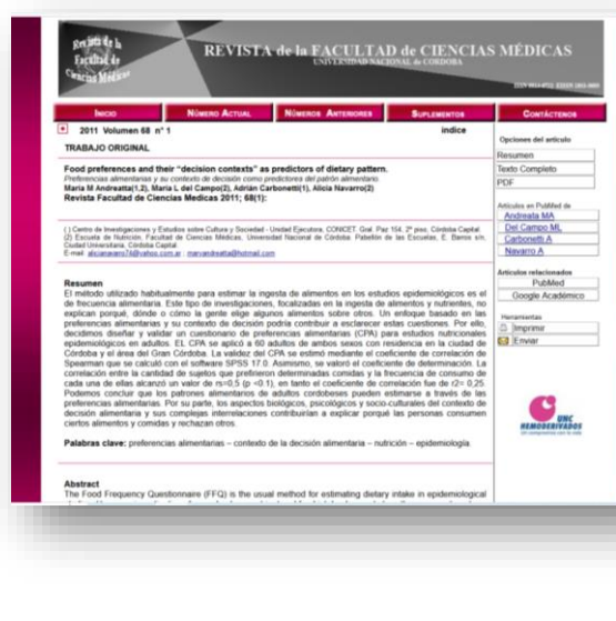
Figura N°2. Vista de un artículo publicado con la interfaz utilizada desde el año 2009 al 2015.