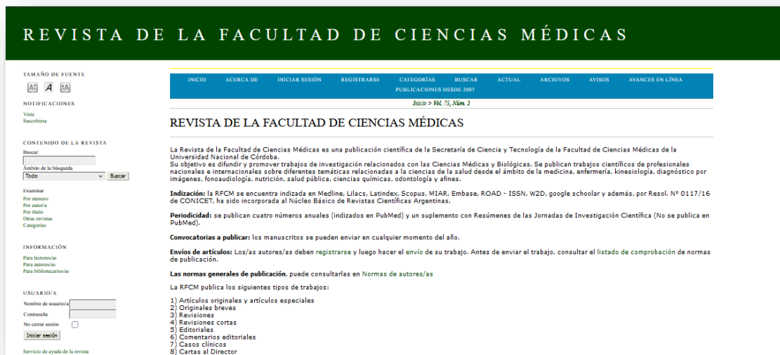
Figura N° 5. Interfaz de la RFCM con la plataforma OJS a partir del año 2016.