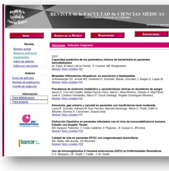
Figura N°1. Interfaz de la Revista de la Facultad de Ciencias Médicas. Aproximadamente desde el año 2009 al 2015.

A partir del año 2009, la página tuvo un dominio independiente de la biblioteca: http://www.revista.fcm.unc.edu.ar . La nueva página web incluyó información más completa sobre el equipo editorial, eISSN activado e incorporó publicidades de importantes instituciones de Córdoba. Su identidad visual respondía a los requerimientos de calidad de los organismos evaluadores (Figura: 1 y 2).