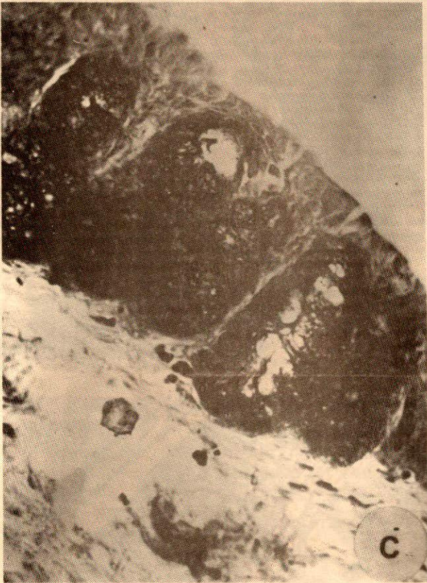
FIGURA 1: C: Sulfomucinas intensamente metacromáticas en glándulas mucosas intraepiteliales de Myiopsitta monacha . Coloración Azul de toluidina pH 3,8. 400 X.