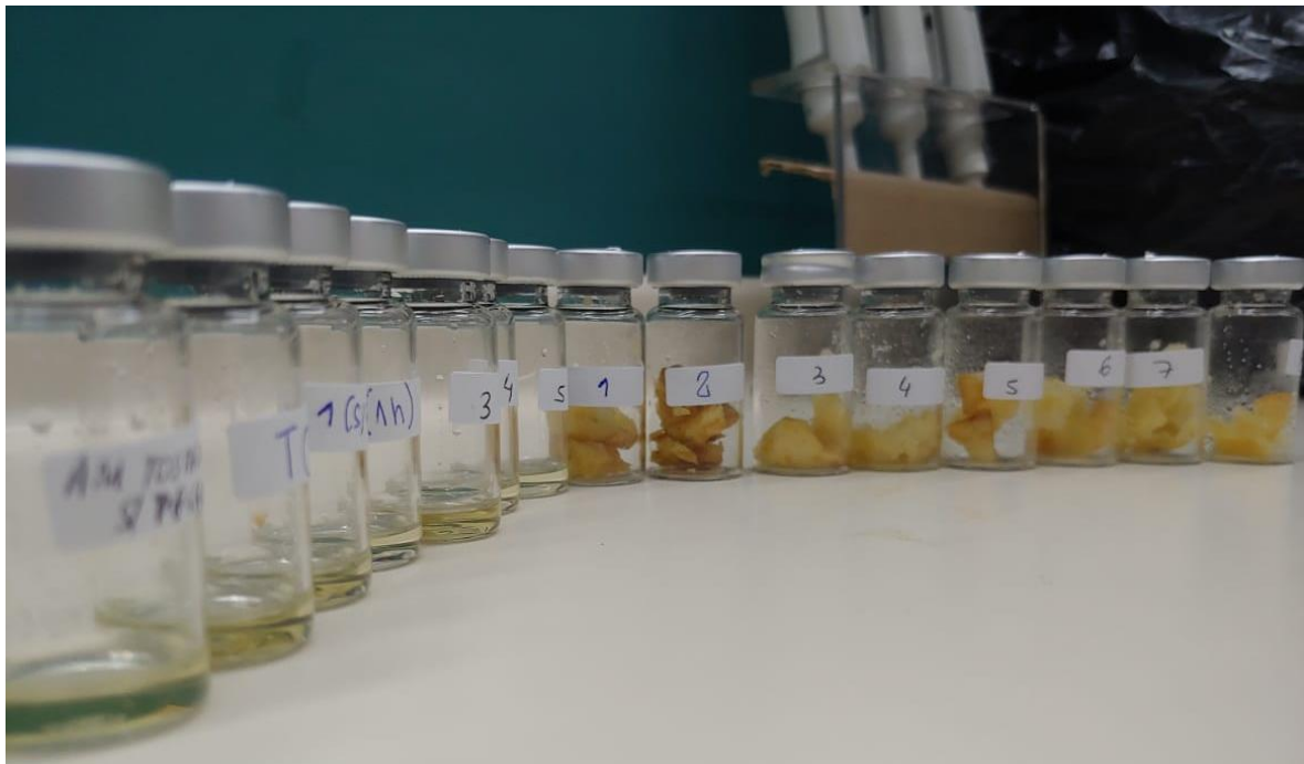
Figura 5: Investigación de volátiles de deterioro y de sabor sobre aceite de fritura y papas fritas por medio de Cromatografía Gaseosa acoplada con Detector de Espectro de Masa (CG-MS) por medio de fibras de absorción en viales sellados (Seguridad Alimentaria, LabTA, FCA – UNC).

prevenir la rancidez. Hay un renovado interés en el mayor uso de antioxidantes naturales tales como los aceites esenciales de plantas aromáticas para prolongar la vida útil de alimentos con alto contenido lipídico (Olmedo, 2008; Olmedo, 2009).