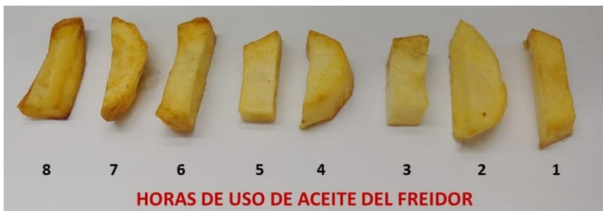
Figura 2: Deterioro de la calidad e inocuidad que presenta las papas fritas a medida que se fríen en un aceite que se va deteriorando (LabTA-FCA-UNC). Las horas expuestas son las horas de uso del aceite en el freidor.

Los alimentos con alto contenido de lípidos, incluidos los fritos, se han asociado con una serie de problemas que impactan en la salud humana e incluso con muertes prematuras. El consumo de los alimentos descritos se correlaciona con obesidad y sus comorbilidades crónicas y mayor riesgo de cáncer, tales como el de próstata, diabetes tipo 2 y enfermedades cardiovasculares (Banerjee, 2017; Mohammad Hossein, 2019). Este último grupo de enfermedades, cuya prevalencia viene en franco aumento en nuestro país y en el mundo, se encuentran íntimamente relacionadas al estilo de vida de la población; siendo la alimentación uno de los aspectos más importantes (Ministerio de Salud de la Nación, 2016).