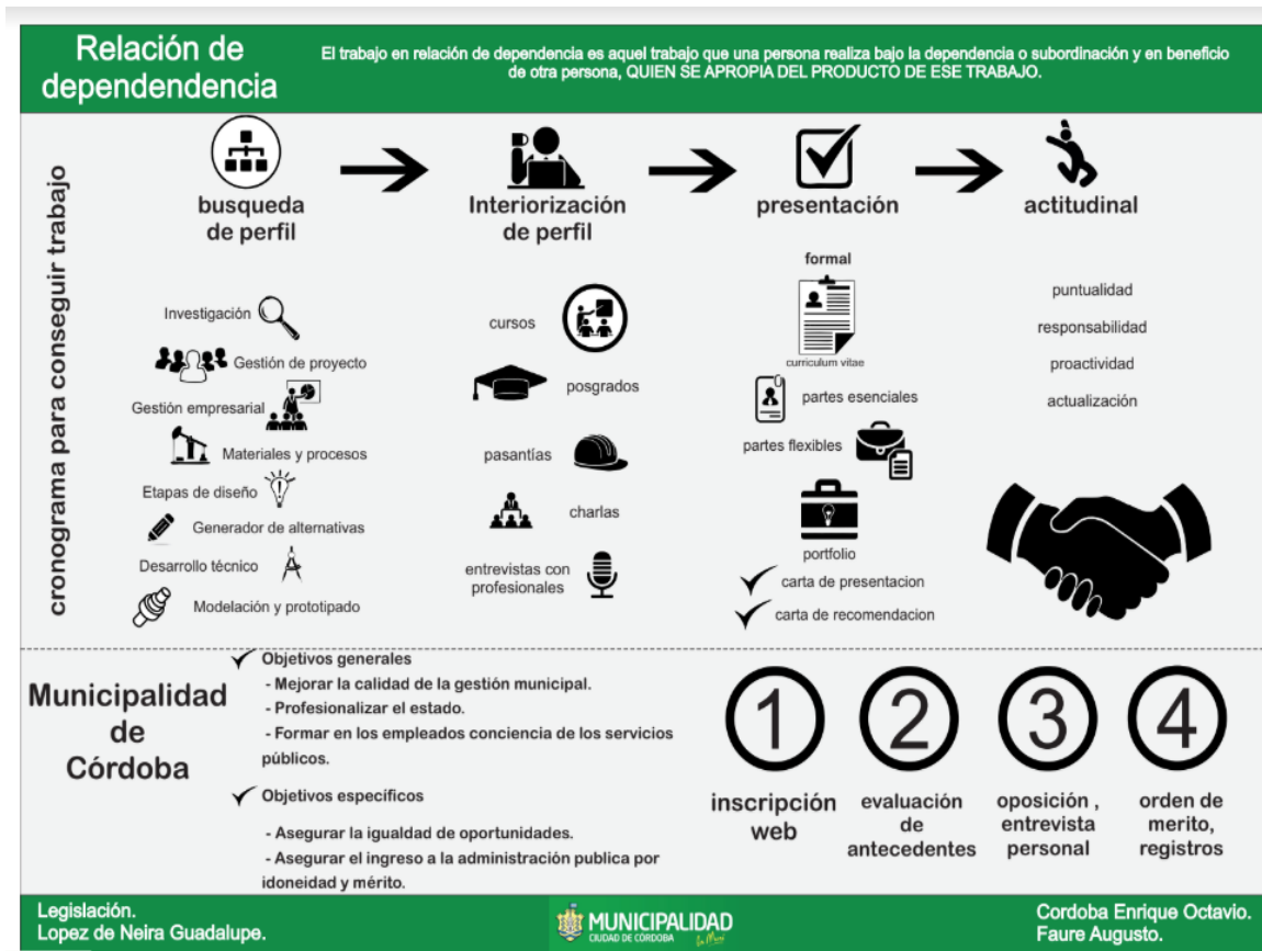
Figura 4. Infografía relación de dependencia