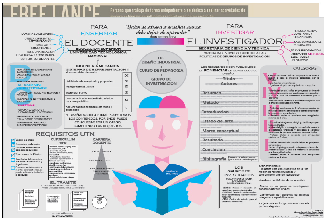
Figura 2. Infografía free lance. Fuente: alumnos Bustos, Santiago y Arroyo, Mauro. 2017