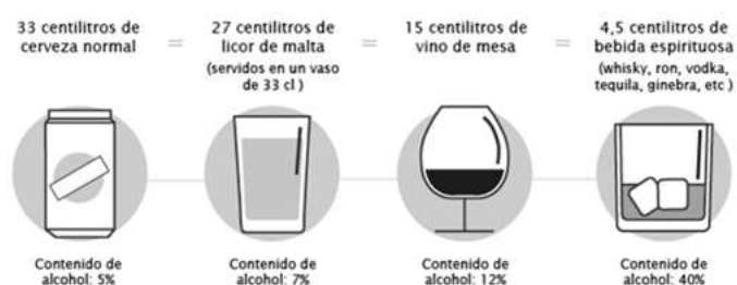
Figura 1. Representación gráfica del concepto de trago, según se lo usa en la literatura científica. El porcentaje de alcohol puro, expresados aquí como alcohol por volumen, varía según la bebida.

Es relativamente difícil preguntarse si la prevalencia de las primeras conductas de consumo de alcohol (i.e., sorbos) en niños y niñas ha ido elevándose a lo largo de las últimas décadas. Los estudios sobre el tema son relativamente recientes (Donovan & Molina, 2014; Wadolowski et al., 2015) e incluso no necesariamente comparten las mismas variables, lo que dificulta las comparaciones. Una variable que sí permite este tipo de análisis es la edad de inicio del primer trago de alcohol (Grant & Dawson, 1997, 1998; Rubio Valladolid et al., 1995). Nótese que en la literatura científica al concepto de trago se lo emplea de una manera muy precisa: un trago o “unidad estándar” de bebida contiene entre 10 a 14 gramos absolutos de alcohol (dependiendo de la zona geográfica y características culturales) y es la cantidad que se encuentra habitualmente en una lata de cerveza de 330 cm 3 , en un vaso de vino o licor o en un vaso de bebida blanca o espirituosa. La figura 1 ilustra este concepto.