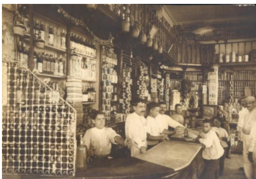
Típica bodega de barrio