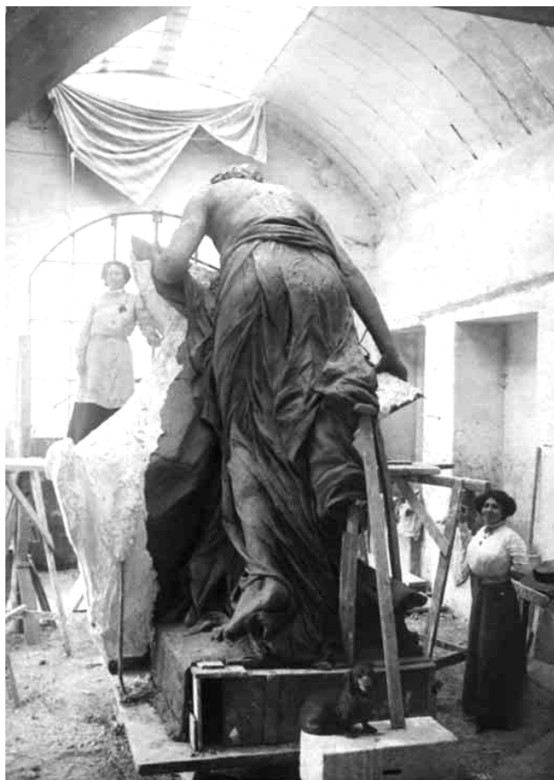
Fig. 1. Lola Mora sobre un andamio en su taller de Roma junto a la figura que coronaría el Monumento.