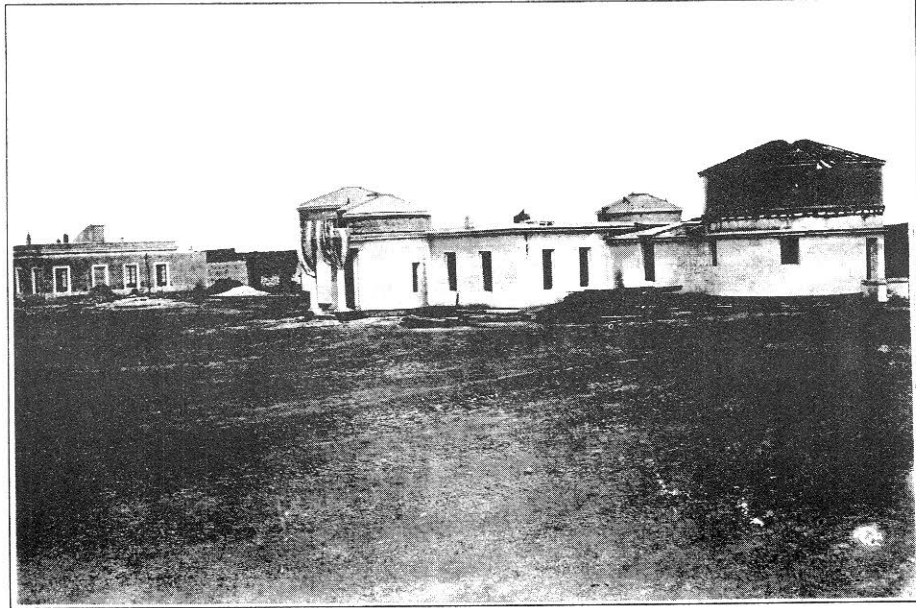
El Observatorio Astronómico Nacional de Córdoba a fines del siglo XIX.