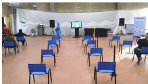
Sala de recuperación post-vacunación.

Asimismo, hubo una preparación del personal administrativo que tenía la responsabilidad de la carga de información en el Sistema Informático de Salud Argentino (SISA). Su tarea era ir registrando cada vacuna al Registro Nominal de Personas Vacunadas (NomiVac). Este método funcionaba como una libreta sanitaria en línea, que permitía contar con información acerca de la población vacunada, incorporando datos personales y de la respectiva vacuna (Nación, 2023). Los primeros que recibieron la vacuna por recomendación de la OMS y de las autoridades sanitarias fue el personal de salud (denominados esenciales), los adultos mayores y las fuerzas de seguridad.