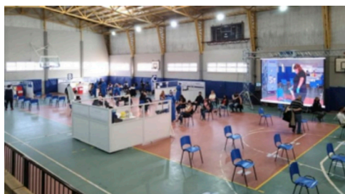
Gimnasio 17 de octubre en una jornada de vacunación.

Particularmente, el Gimnasio 17 de octubre es un edificio de grandes proporciones, utilizado por la comunidad para diversas actividades deportivas. En esta oportunidad fue modificado para establecer áreas definidas para la recepción de las personas y su respectiva circulación. Entre ellas área de 1) ingresos y registro de cada persona (registros epidemiológicos), 2) aplicación de la vacuna, 3) espera ante posibles efectos adversos, y 4) salida de los vacunados.