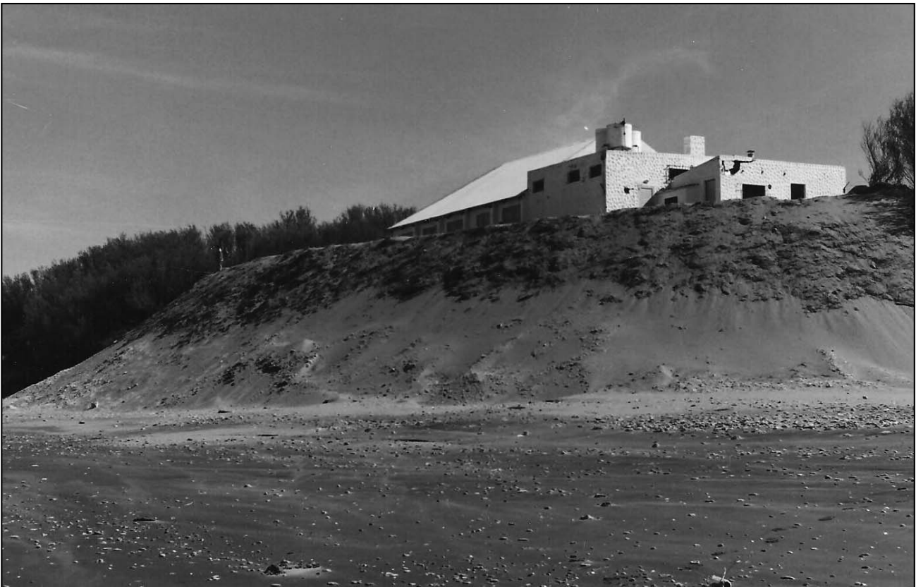
Figura 7. Obra cubierta con arena con sembrado de Carpobrotus edulis , "uña de gato".