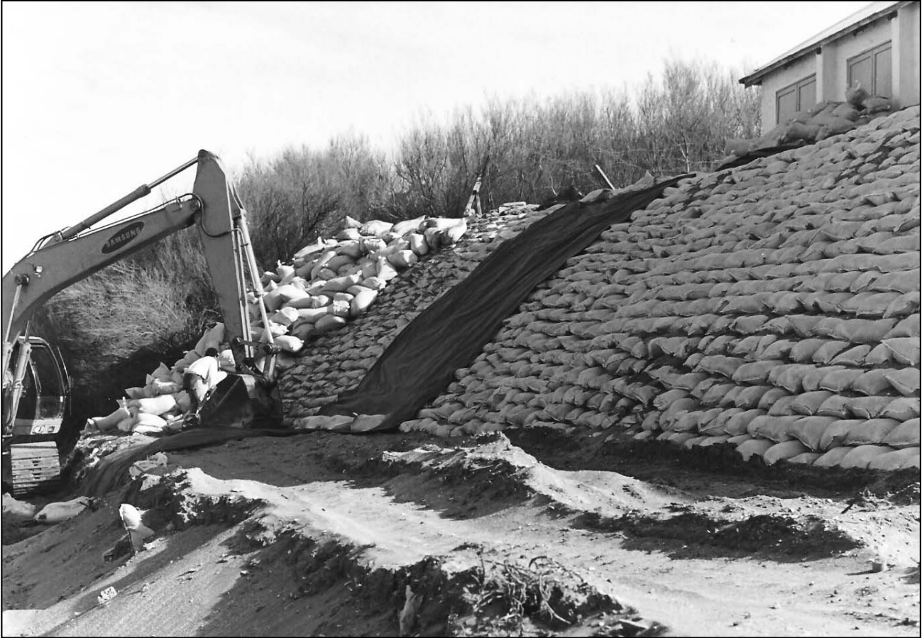
Figura 6. Colocación de membrana geotextil.