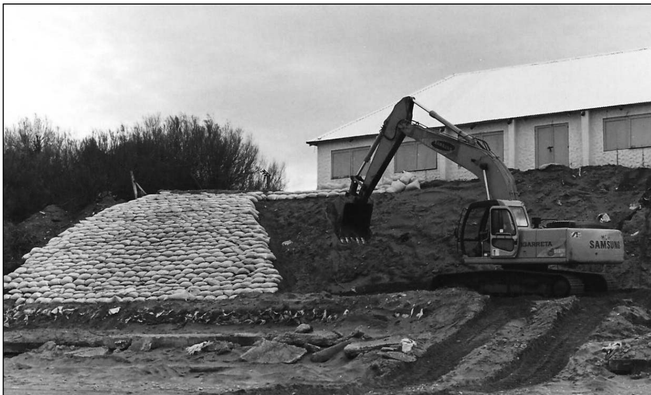
Figura 5. Colocación de las bolsas rellenas con arena.

Se recomienda realizar mantenimientos periódicos de fácil y económica solución, y no ejecutarlos solamente durante las tormentas erosivas.