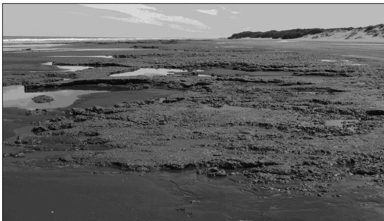
Figura 3. Perfil de playa con afloramientos rocosos.