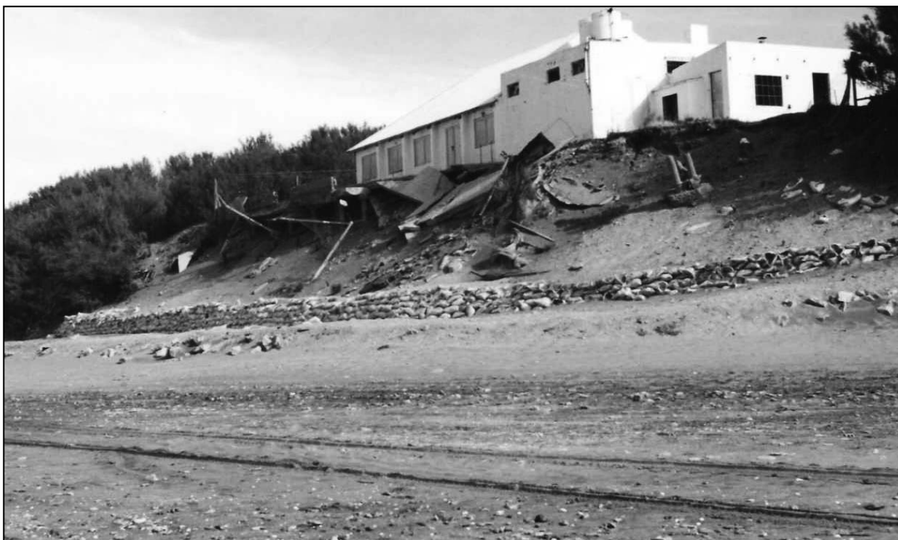
Figura 1. Estado de la duna y construcción al comienzo de las obras de defensa.

El sistema costero está compuesto por un campo de dunas, que respalda a la playa de orientación este-oeste. Están caracterizadas por arenas cuarzosas de colores amarillentos, de granulometría media a fina, que forman el cordón arenoso costanero y faja medanosa de la provincia de Buenos Aires. Se extiende a lo largo de 600 Km de costa Atlántica con un ancho variable de 3 Km promedio. Estas dunas alcanzan alturas máximas del orden de 25 msnm y medias entre 5 y 10 msnm y representan el relicto arenoso generado por la acción del mar sobre los sedimentos pampeanos y sometidos posteriormente a la acción del viento (Auge, 2004). El campo de dunas se interrumpe entre Santa Clara del Mar y Chapadmalal debido a la existencia de barrancas formadas en los sedimentos pampeanos.