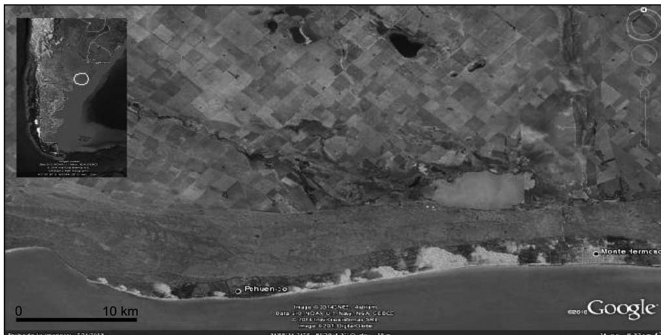
Figura 2. Ubicación del área de estudio.

La ubicación relativa de centros ciclónicos y anticiclones da lugar a los distintos vientos de la región. Los vientos predominantes son netamente terrestres, de los sectores N, NE y NO que en conjunto constituyen el 43,9 % de la frecuencia, los marinos del S, SO y SE suman el 28,2 % del total, el resto