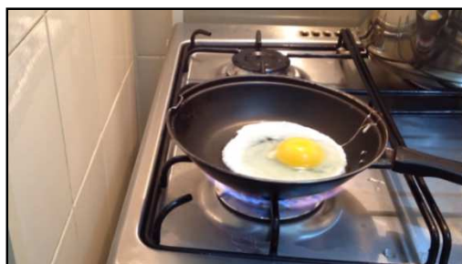
FIGURA 1. Ovo fritando ( http://youtu.be/aWX1-awJ56c ).

De forma dialogada perguntou-se aos alunos o que eles compreendiam como irreversível e, posteriormente às respostas e discussões, foram apresentados alguns vídeos que demonstravam processos irreversíveis que estavam presentes no dia-a-dia. Como por exemplo, pode-se verificar a Figura 01, que demonstra um ovo sendo frito. O vídeo mostra o processo que ocorre quando se fritar um ovo e na sequência roda-se o vídeo de trás para frente e os alunos foram questionados sobre a possibilidade de ocorrência desse processo.