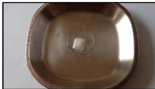
FIGURA 2. Gelo derretendo ( http://youtu.be/aWX1-awJ56c ).

O mesmo é feito apresentando um cubo de gelo derretendo sobre um recipiente metálico. Da mesma forma pergunta-se se é possível realizar o processo inverso, ou seja, reverter o processo de derretimento do gelo.