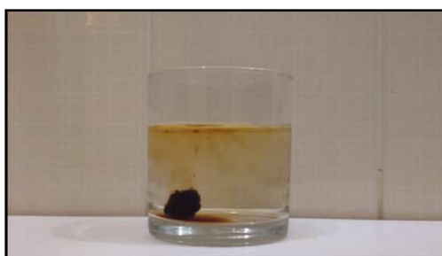
FIGURA 3. Café dissolvendo-se ( http://youtu.be/aWX1-awJ56c ).

Em seguida utiliza-se o vídeo do desodorante sendo espirrado, que também possui o sentido direto e o sentido reverso da imagem. Pergunta-se aos alunos como eles identificaram qual dos dois vídeos estava ocorrendo no sentido correto. Aqui se esperava respostas ligadas a organização do líquido na saída e espalhamento, quanto mais distante estivesse do bico. Inicialmente gerou certa confusão, pois os alunos haviam visto o vídeo apenas no sentido inverso. Porém, logo em seguida, afirmaram que as partículas do pó de café deveriam ficar mais dispersas no líquido e que o desodorante, quando espirrado, saia mais fino (organizado) próximo ao bico e depois se espalhava.