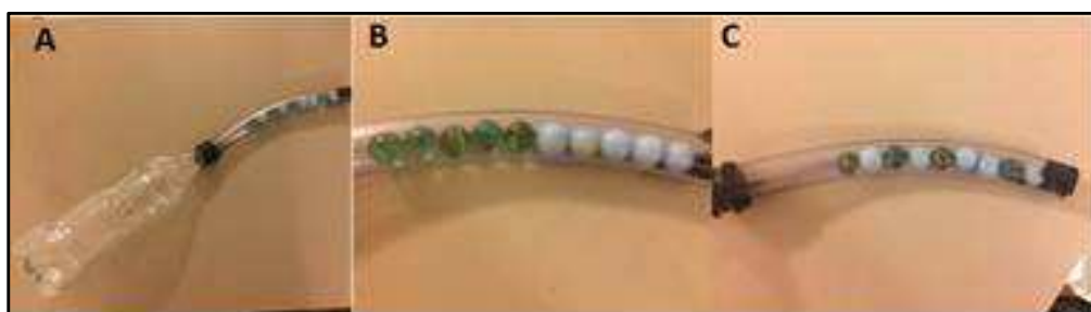
FIGURA 5. Experimento de entropia.

Por fim, para complementar a interpretação entre a irreversibilidade e a entropia de um sistema, utilizou-se do experimento da garrafa e bolas de gude. Esta atividade consistia em colocar 10 bolas de gude em uma garrafa ligada a um tubo. Havia 05 bolas da cor azul, simulando as moléculas de um gás e outras 05 verdes representando espaços vazios, conforme pode ser visto na Figura 05. Na primeira situação as bolas azuis são dispostas juntas conforme representado em B na Figura 05. Esta situação representa um estado “organizado” onde as moléculas estão próximas umas das outras. Aqui se pode pensar em um momento parecido com o observado no início do vídeo do café. Logo depois, as bolinhas são retornadas para a garrafa, misturadas de forma aleatória simulando o passar do tempo e novamente voltadas para o tubo, conforme representado em C.