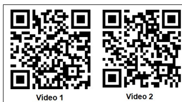
FIGURA 2. QR CODE vídeos educativos da Comissão de Acidente de Transportes (TAC) do estado australiano de Victoria.