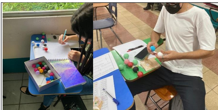
FIGURA 2. Estudiantes trabajando en la construcción de moléculas con la caja didáctica desarrollada para el abordaje del tema de geometría molecular.

Por otro lado, se estableció que el recurso cumple con las características de una actividad lúdica y propició la participación y trabajo grupal, motivando los procesos de aprendizaje de los estudiantes, al mismo tiempo que despertó el interés de los estudiantes por el tema de geometría molecular y las teorías que lo sustentan.