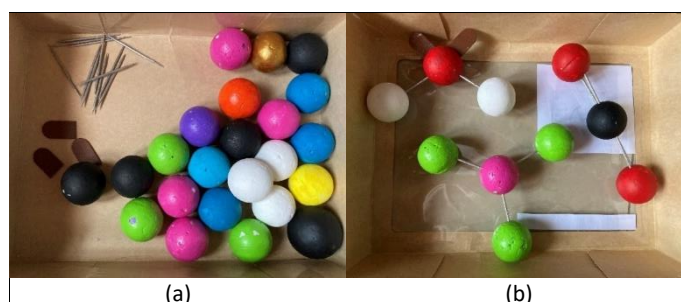
FIGURA 1. a) Caja didáctica empleada en la experiencia; b) muestra de algunas moléculas que se pueden armar con este recurso. H 2 O (arriba), AlCl 3 (abajo) y CO 2 (derecha) La simbología del color de las esferas se puede consultar en la tabla I.

Como se ha mencionado, el LE es un modelo que permite la integración de estrategias pedagógicas orientadas al desarrollo de la actividad experimental mediadas en entornos digitales. Idoyaga et al (2020) plantean diversos tipos de actividades, donde destacan las simulaciones, laboratorios móviles (LM), laboratorios virtuales (LV), laboratorios remotos (LR) y las actividades experimentales simples (AES) que son el centro de los experimentos caseros y poseen muchas similitudes con las actividades que se realizan en los laboratorios tradicionales, con la particularidad de que las AES son más sencillos y seguros, además, no requieren una infraestructura y equipo especializado para su desarrollo y en general son de bajo costo (Idoyaga, 2022).